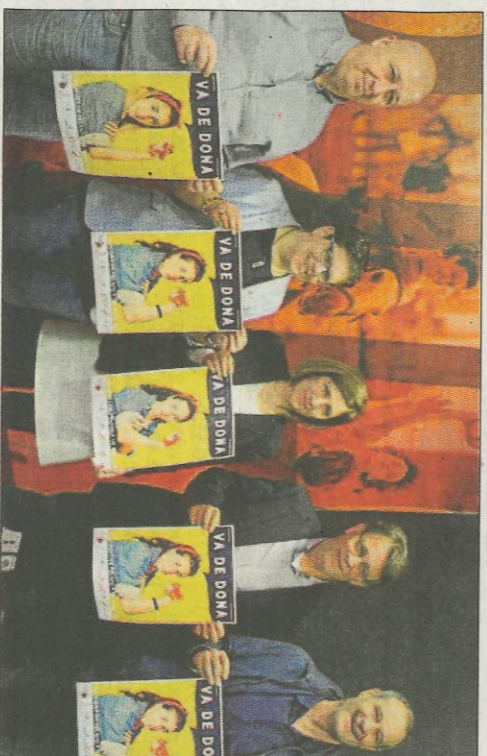
Imatge de la presentació de Va de Dona en La Petxina. FP

De la mà de la Federació i amb la col·laboració de les institucions públiques i un bon nombre d'entitats privades, les dones de la pilota també tindran el seu dia de reivindicació i reconeixement amb la segona edició de la jornada Va de Dona. Però serà demà. És simplement per