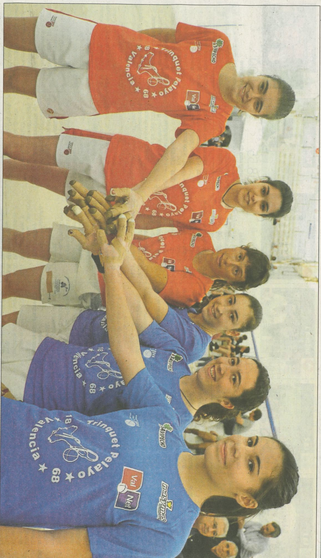
La pilota celebrerà demà el seu Dia de la Dona i per garantir que Pelayo s'ompli com es mereix l'accés serà gratuït dins i fora, on estarà la Fira d'Entitats de la Pilota. FUNDACIÓ