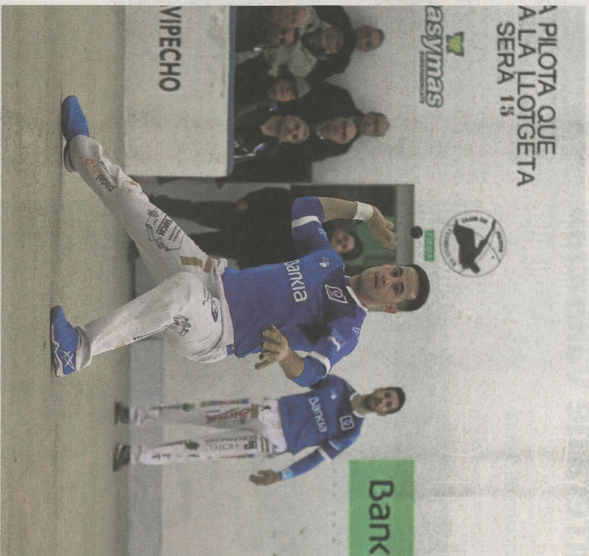
Jesús se dispone a golpear de bot de braç en la semifinal de la Liga de escala i corda.

La segunda semifinal se completará el domingo en Vilamarxant. El mejor equipo hasta la fecha, la pareja que componen Puchol II y Nacho, medirá sus fuerzas contra el trío de Francés, Javi y Bueno. Se trata de