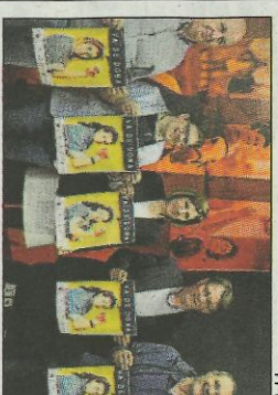
Presentació, ahir, del «Va de Dona».

El Museu Arqueològic de Llíria, inaugurat en 1996, ocupa l'espai on va haver-hi un vell trinquet. L'ajuntament va obrir, en el Pla de l'Arc, un de nova construcció on es manté l'activitat d'escola, club i alguns partides de professionals. Mai va ser fàcil la vida dels trinquets valencians.