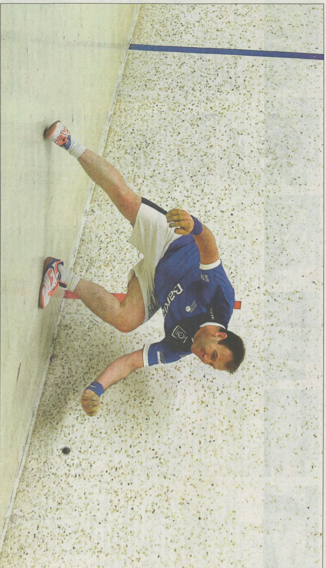
Coeter II està a una victòria de disputar la seua sisena final en la Lliga Bankia de raspall. FUNDACIÓ