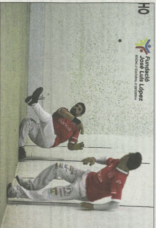
Soro III i Santi s'acomiadaren amb la cara ben alta. FUNDACIÓ

mes. Del mitger no es pot dir que va ser l'artífex de la victòria perquè la passada a la final va ser cosa de tres, però el de Silla va estar senzillament perfecte. Les seues rematades van ser constants, fortes i ben dirigides. I a més es va buidar en defensa, principalment per a cobrir la dreta de Pere Roc II, labor en la qual va obsequiar al públic amb un gran nombre de restades inverses-blants.