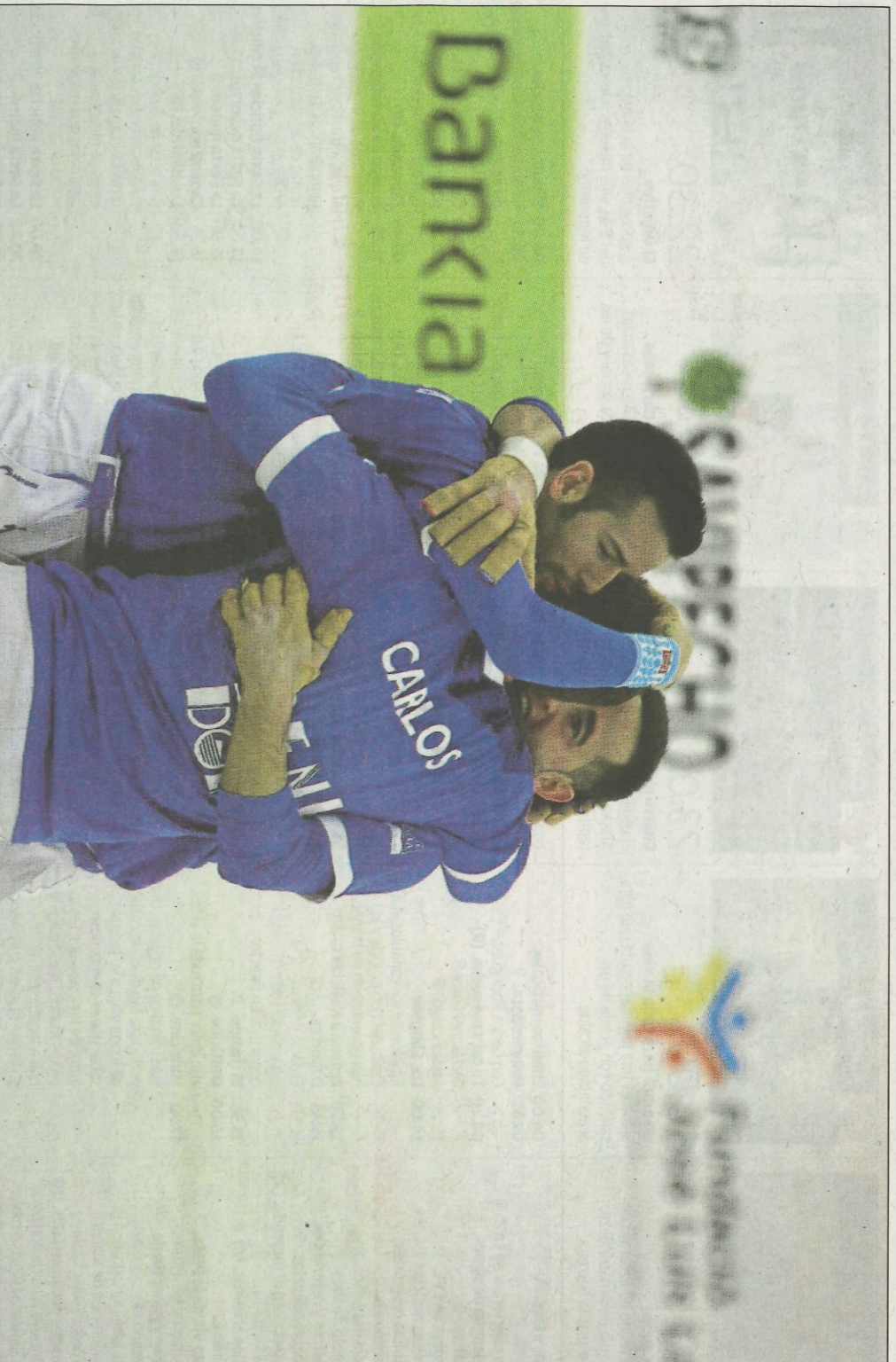
L'instant posterior a la consecució del quinze definitiu, ahir a Pedreguer. FUNDACIÓ