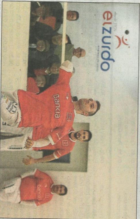
Santi té especial habilitat per a trobar la llotgeta a Pedreguer. FP

El primer billet per a la final del dia 18 a Pelayo s'atorga esta vesprada en el trinquet de Pedreguer. La semifinal té cartell de final. No en va s'enfronten els escaleters que ara fa un any/jugaren pel títol. En aquella ocasió, la glòria va ser per a Pere Roc II, juntament amb Félix i Monrabal. Mesos després el de Massamagrell i la tornava al de Benidorm en guanyar-li en la final del mà a mà. Shan convertit en enemics íntims. La trajectòria d'ambdues for-