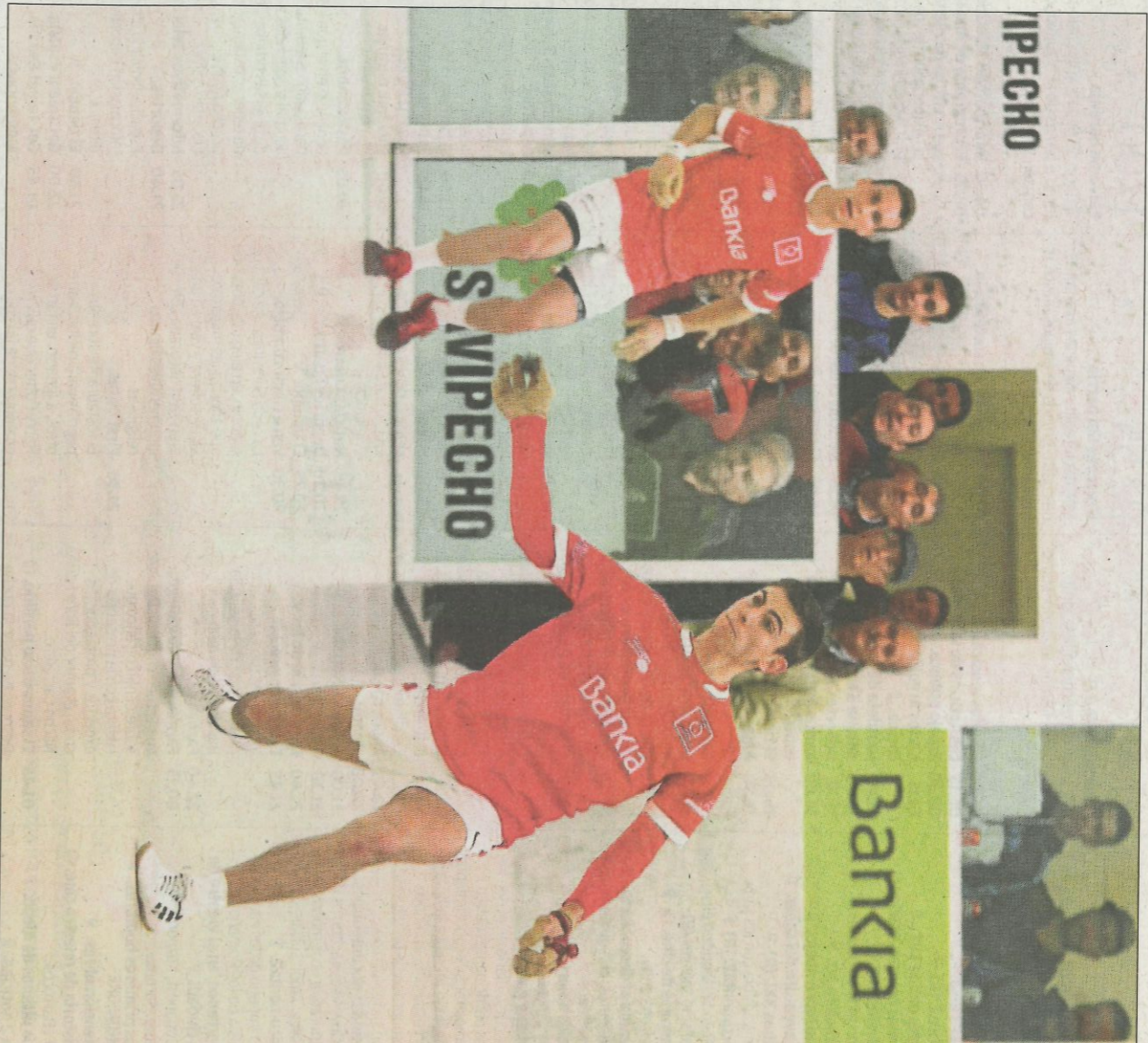
L'equip de Barxeta lidera la classificació tot i que iguala a punts amb el de Senyera. FUNDACIÓ

Tal vegada siga una final anticipada tenint en compte la trajectòria