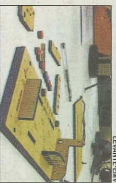
Joc de taula de llargues.