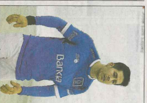
Miravalles, a la Lliga de raspall. FR