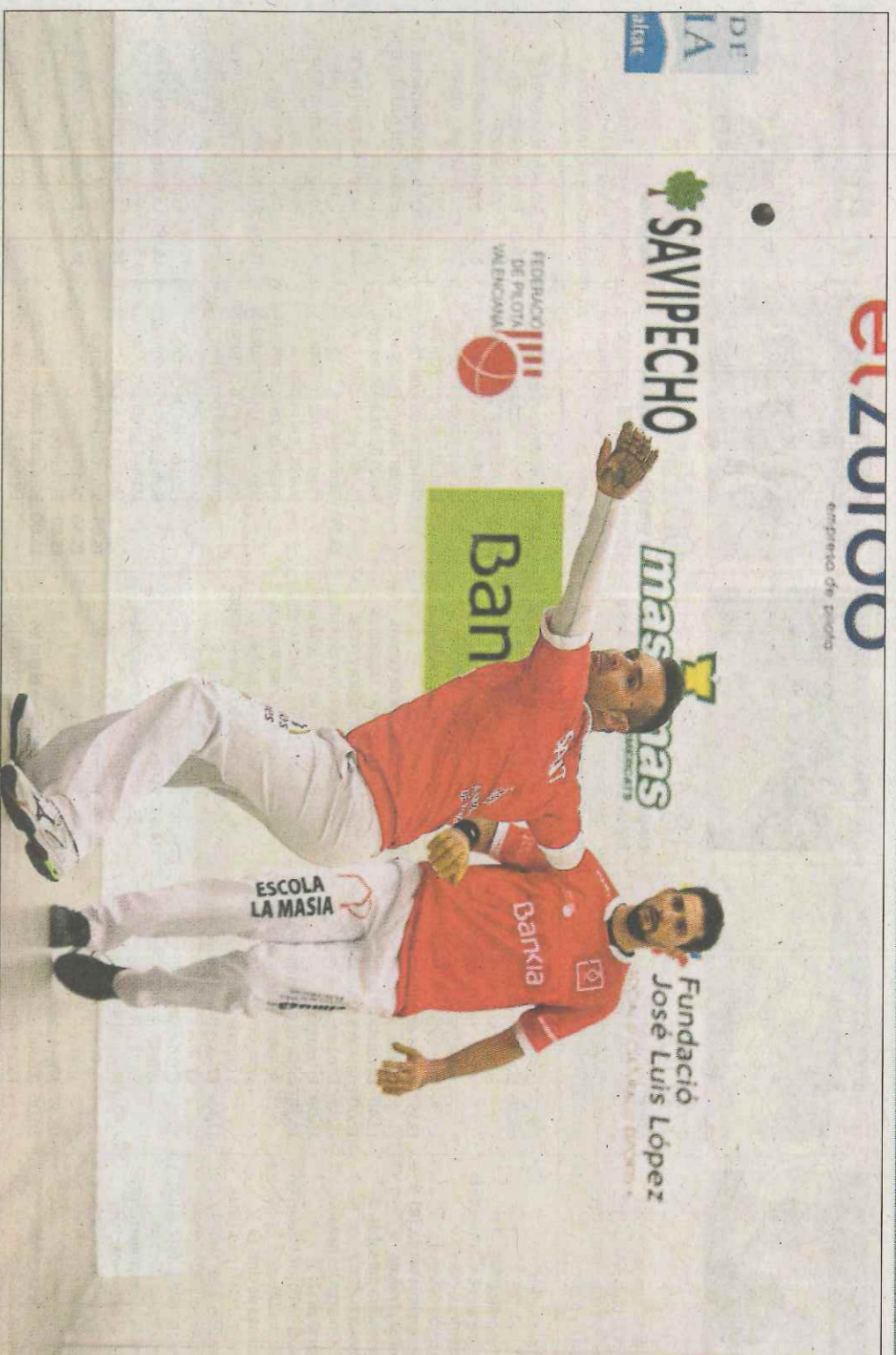
L'única opció vàlida per a Soro III i Santi era la victòria i la van aconseguir amb una gran actuació. FUNDACIÓ