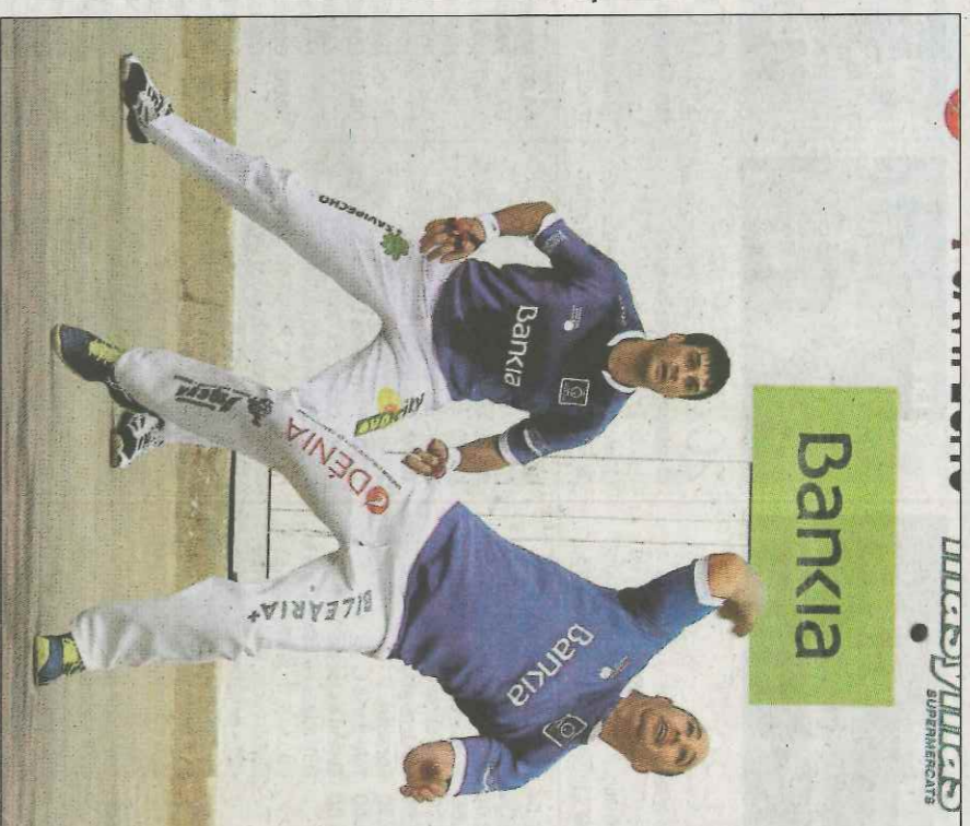
La partida de hui és una final per a l'equip de Muria. FUNDACIÓ

Es, per tant, una confrontació que permetrà afrontar la conclusió d'esta ronda en una situació privilegiada i amb cert marge d'error o que implicarà jugar-se la classificació a una carta. El que és segur és que els dos equips estan sent dels millors de la competició.