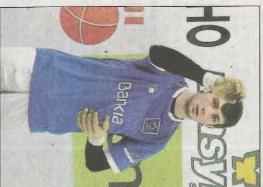
Montaner d'Almiserà. FUNDACIÓ

Les línies capdavanteres també signaren una destacada actuació. Coeter II va aprofitar les dimensions relativament reduïdes del trinquet per a explotar la seua tècnica i a més va a més va interceptar