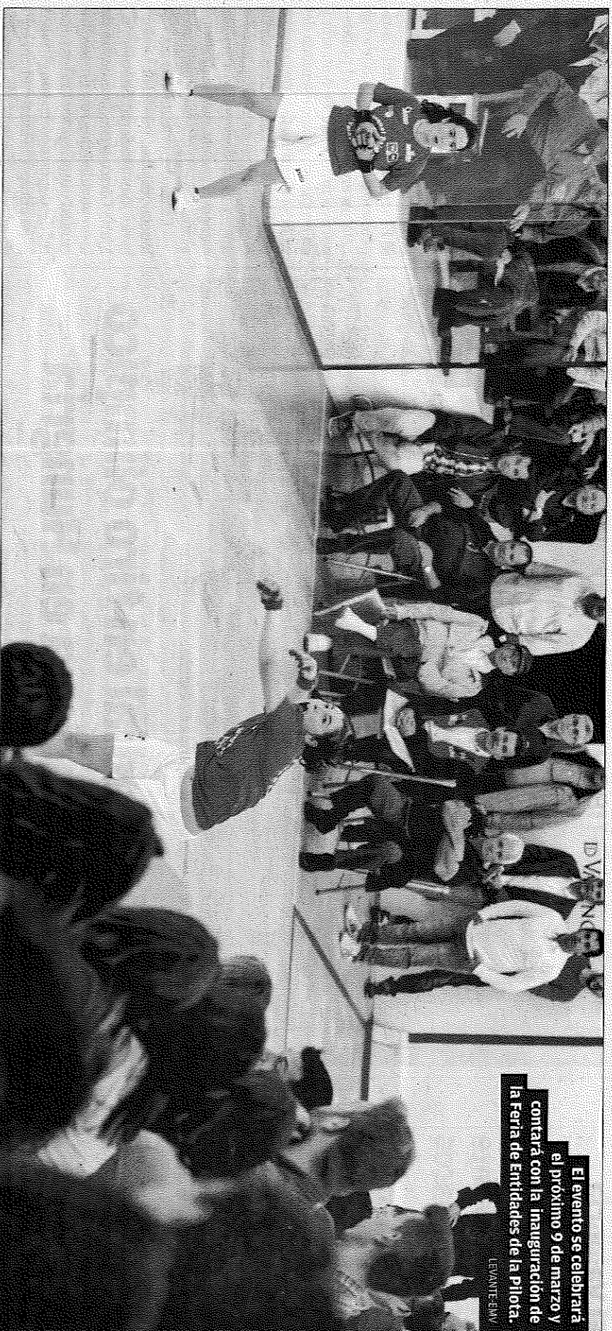
El evento se celebrará el próximo 9 de marzo y contará con la inauguración de la Feria de Entidades de la Pilota.