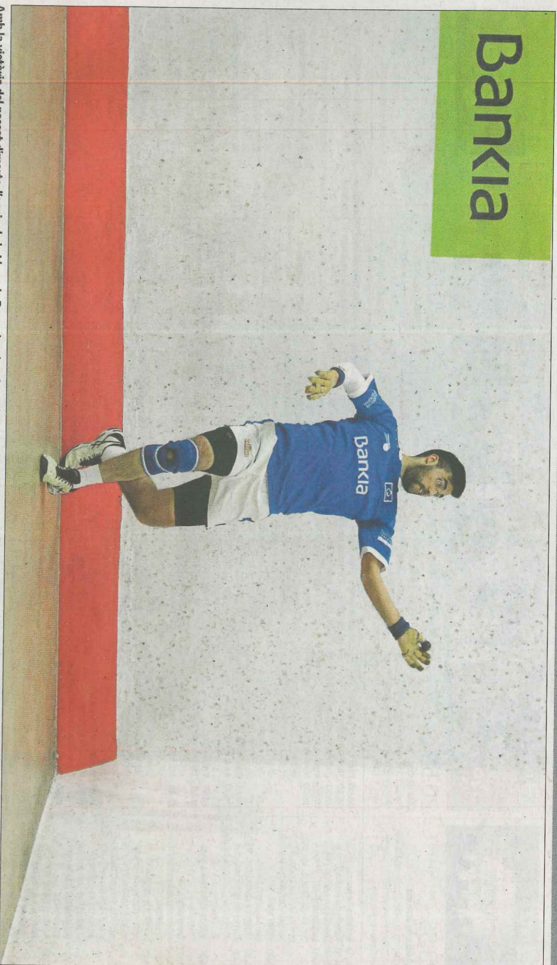
Amb la victòria del passat dimarts, l'equip de la Llosa de Ranes ha abandonat l'última posició per a situar-se quart en la Lliga Bankia de raspall. FUNDACIÓ