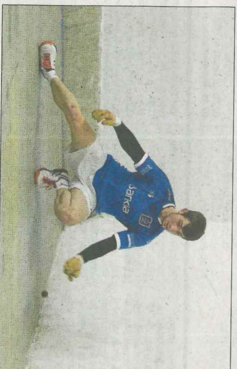
Guadi es jugarà la passada a semifinals contra l'equip de Montaner. FP

Això sí, al de la Llosa de Ranes li ha costat començar a gaudir de la competició. «Al principi m'he vist molt mal. He notat pressió pel fet de tornar a la Lliga, la primera setmana vaig estar amb febra i a més vaig tindre una punxada en el colze. Ho he passat mal en les dues primeres partides. Per unes coses o al-