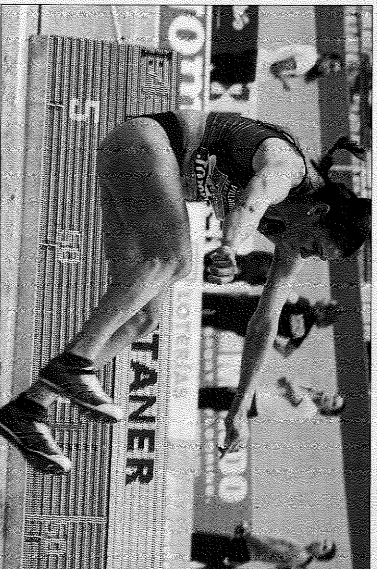
Montaner logró el bronce en el Campeonato de España el pasado fin de semana en València.

Ahora, cinco años después del positivo definitivo de Kotova y hasta doce desde aquel campeonato mundial en Rusia, la valenciana, que sigue en activo con 37 años, re-