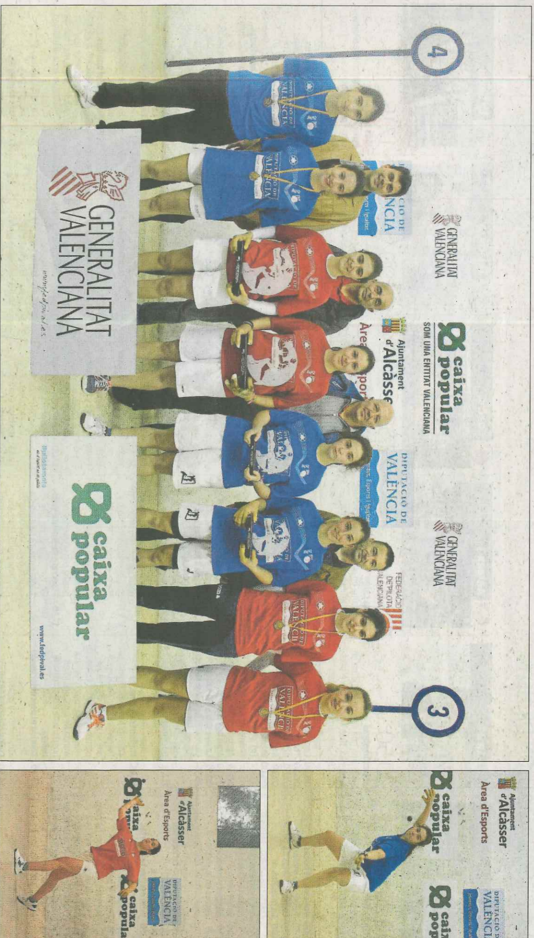
Imatge de les finalistes sub-23 de raspall femení possant amb els trofeus després de les finals.