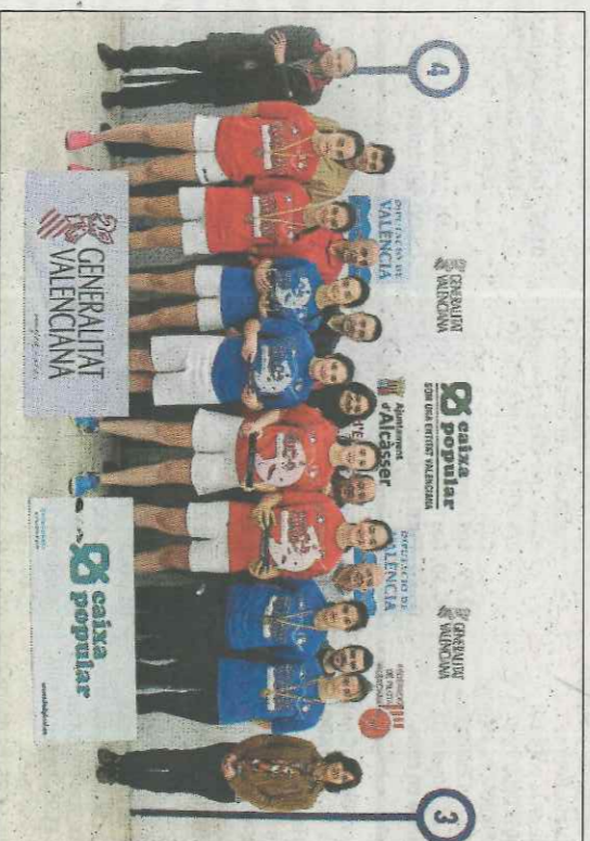
Les finalistes sub-18 de raspall femení possen en el Trinquet d'Alcàsser.