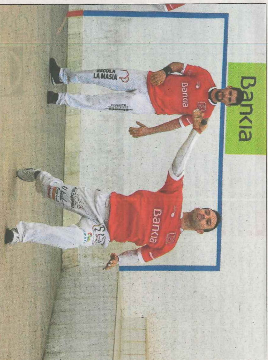
Santi va ser ahir el mitger ofensiu i amb capacitat de quinze que necessitava el seu equip. FUNDACIÓ

La jornada definitiva començarà el dissabte en el trinquet Pelayo on jugaran els equips de Puchol II i Genovés II, ja en diumenge, Marc i Pere Roc II s'enfrontaran a Xàbia mentre que Soro III es mesurarà a Francés a Bellreguard.