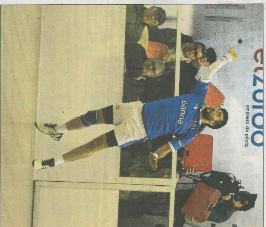
L'equip de la Llosa de Ranes reviscola en la Lliga de raspall. FUNDACIÓ