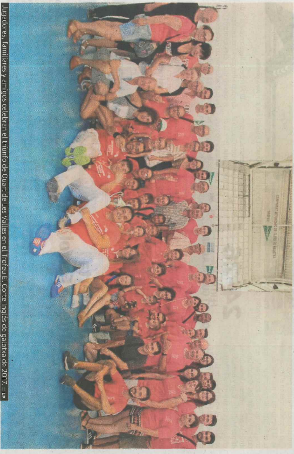
Jugadores, familiares y amigos celebran el triunfo de Quart de les Valls en el Trofeu El Corre Inglés de galotxa de 2017.

Y a Quart le ha permitido convertirse en el primer club en ganar la Copa Generalitat a dos modalidades distintas. Rubrica así un lustro glorioso para la entidad que, sin embargo, cuenta con un entusiasta patrocinador. «Conocemos al gerente de Kiwa en Valencia y empezó apoyándonos con camisetas. Pero es que la empresa es holandesa y los dueños conocían la pelota a mano porque allí se juega a llargues. De hecho,