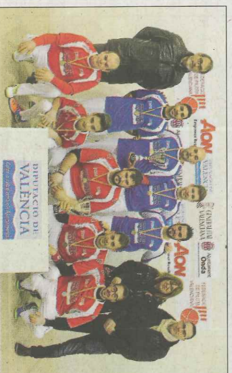
Els locals de l'Onda caigueren en quarta B davant la Pobla de Vallbona.