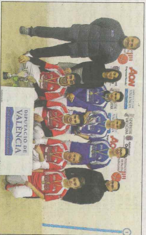
Llíria va guanyar la final que tancava la present edició. SD