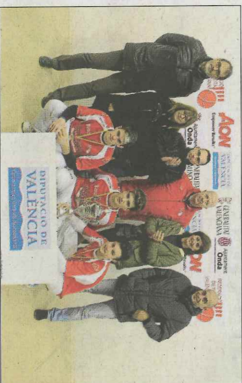
Alfara de la Baronia no va poder reeditar el títol en primera. SD

FINAL PRIMERA CATEGORIA ■ ALIANZA GALADRANS FOIOS A 60 ■ LFARA DE LA BARONIA 50 FINAL CATEGORIA QUARTA B ■ CAIXA POPULAR POBLA VALLBONA D 60 ■ PPSI MAX ONDA C 20 FINAL CATEGORIA VETERANS ■ EL DAUET RIBERA C 60 ■ JUANJO TRADICIONS VALLDIGNA 45