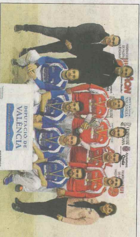
Riba-roja, campions de segona, davant el Moncada. SD