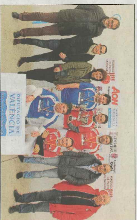
Els veterans de la Llosa s'emportaren el títol. SD

es va tancar amb la final de quarta B, on l'equip local Onda C no podia fer front al joc de la Pobla de Vallbo- na.