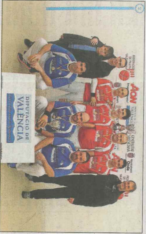
Torrent i Xilxes, protagonistes de la final de quarta A. SD