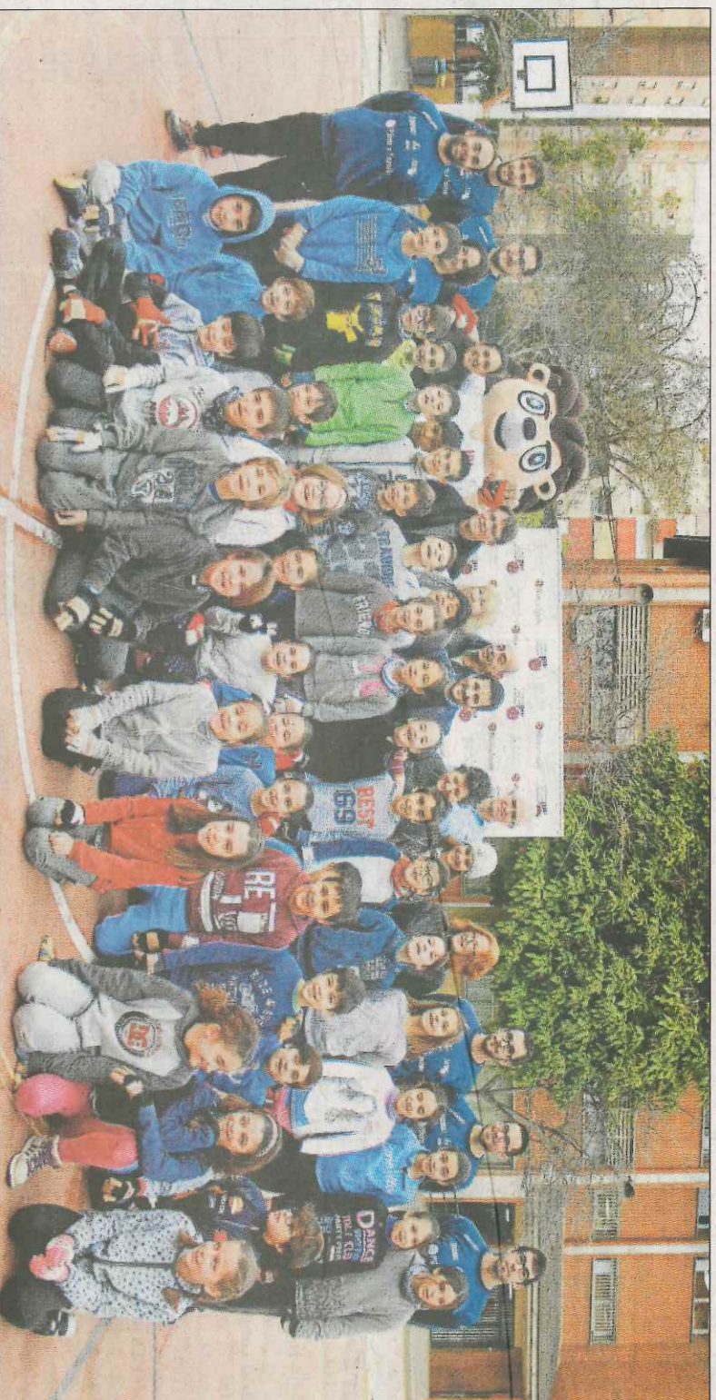
La jornada d'obertura del programa Pilotaj a l'Escola 2017-2018 ha tingut lloc al CEIP Pare Català de València. SP

La principal novetat d'aquesta edició és l'extensió del programa a