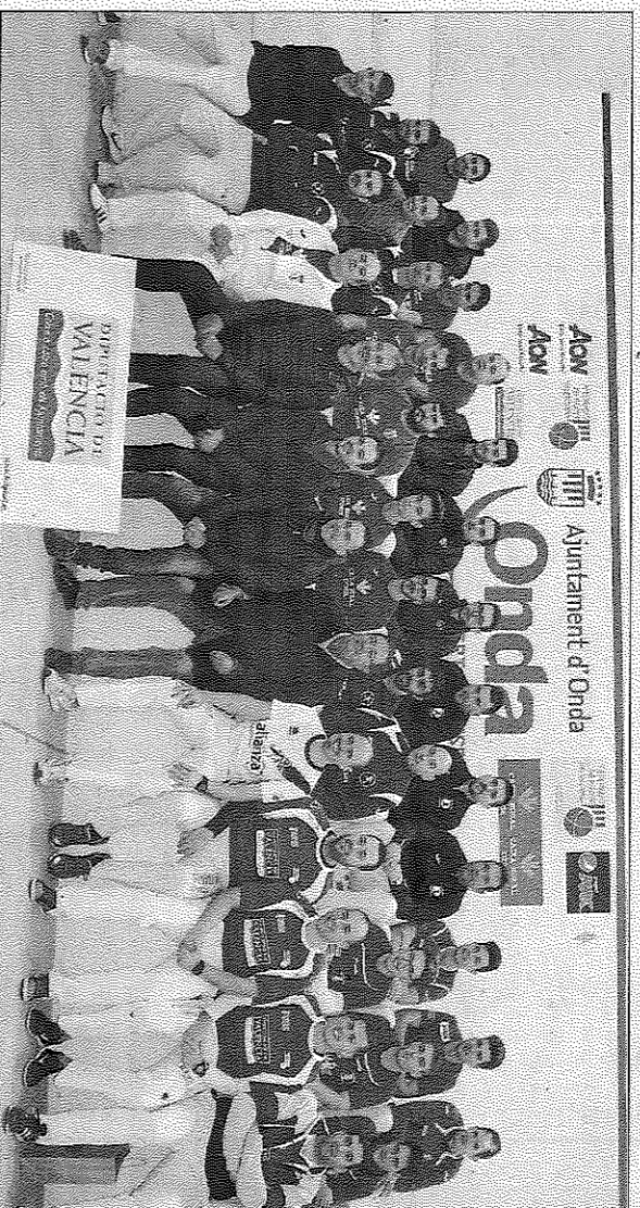
Els protagonistes de les finals de l'AON d'escala i corda el dimarts passat en la presentació a Onda.

El trinquet d'Onda serà de nou la seu d'unes finals oficials de pilota valenciana. Enguany les finals de l'autonòmic d'Escala i Corda tornen després de tres anys, ja que en la temporada 2015 ja fou l'escenari de les últimes partides del campionat. Prèviament, en el 2011, ja havia acollit unes finals oficials, tot i que en aquella ocasió foren del Campionat Autonòmic de Galotxa.