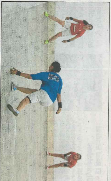
La presència de la dona en la pilota és cada vegada major. FUMPIVAL

La jornada començarà a les 17.00 hores amb la inauguració de la Fira d'Entitats de la Pilota on es podrà veure el moviment cultural i esportiu