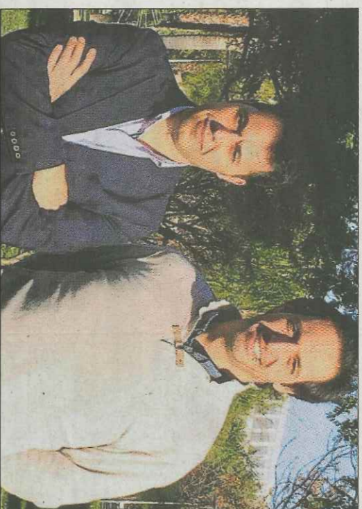
Sanahuja i Waldo negocien ara amb la Fundació. LEVANTE-EMV

A més, el patronat es va mostrar satisfet perquè ha pogut pagar als pilots el sou del mes de gener.