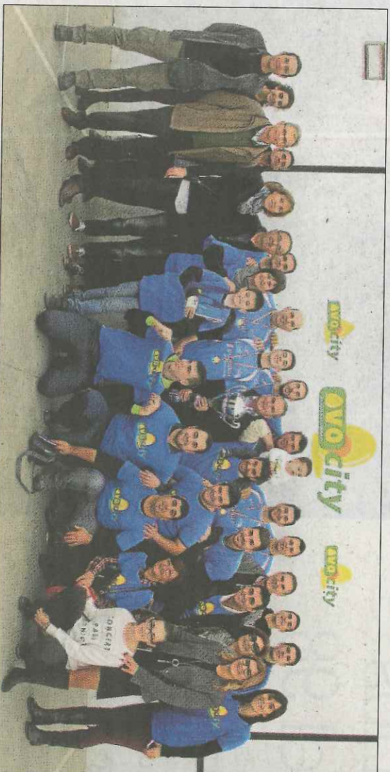
l'equip del Marquesat és un dels clàssics de la galotxa.