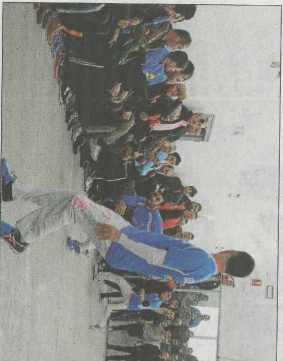
Final de l'Interpobles l'any 2016.