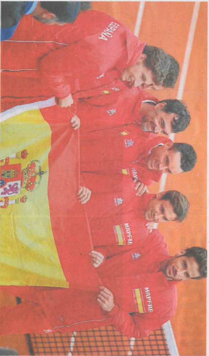
Los integrantes del equipo español posan tras la victoria ante Gran Bretaña.