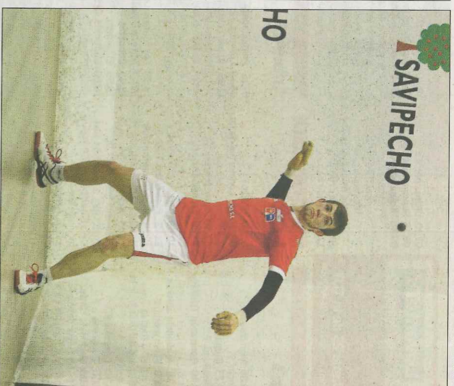
Montaner s'ha entrenat amb victòria en la Lliga de raspall.