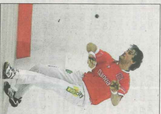
Genovés II, ahir a Sueca. FP

A diferència del debut a Petrer, l'equip de Vila-real sí que va ser capaç de mantenir el ritme de cap a fi de la partida. També va ajudar que els rivals no tingueren el dia, Javi va portar el pes com correspon a la