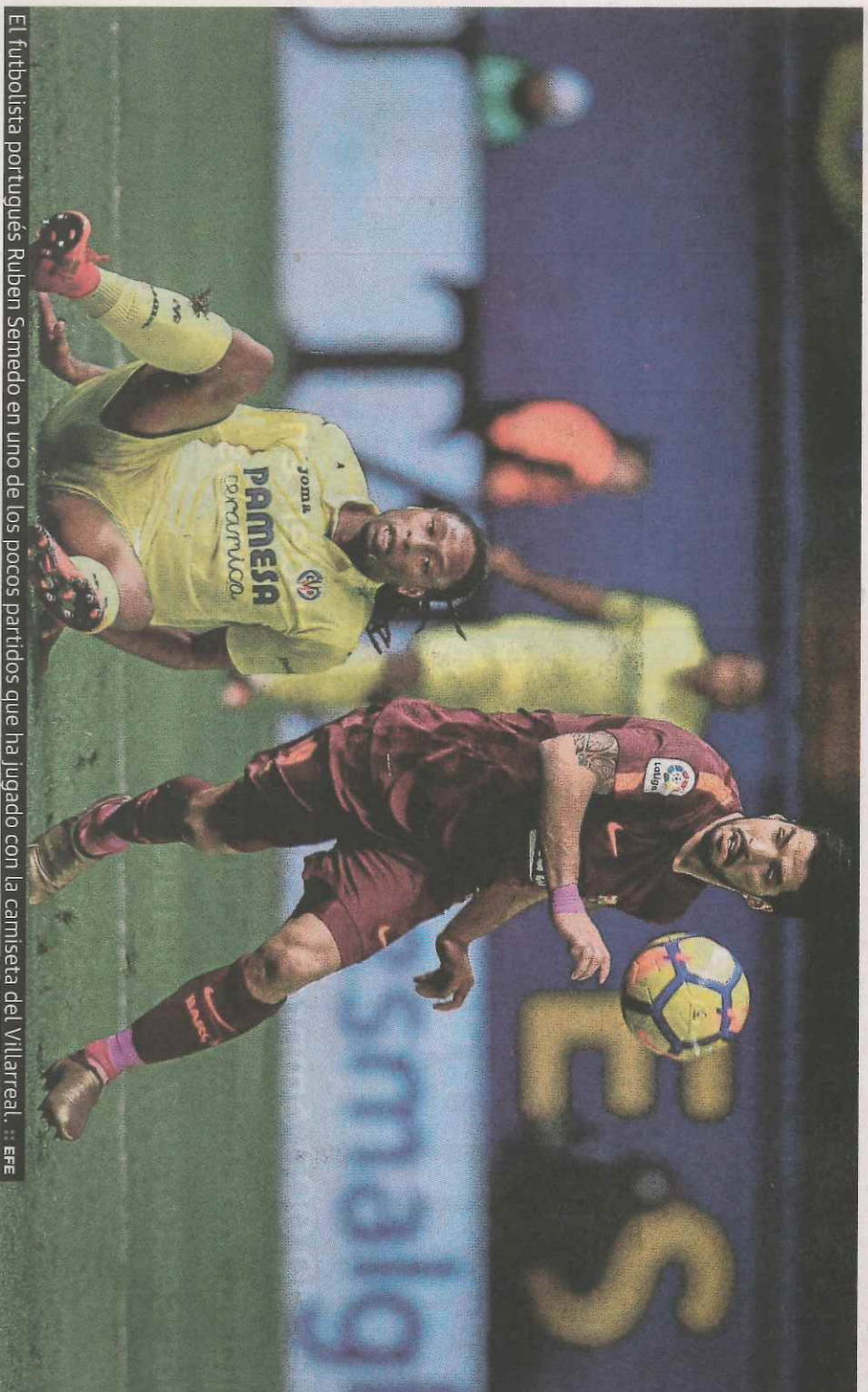
El futbolista portugués Ruben Semedo en uno de los pocos partidos que ha jugado con la camiseta del Villarreal.