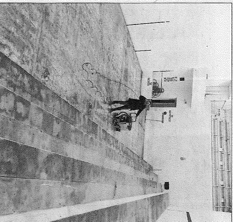
Estat del trinquet de Benissa pel matí, hores abans de la partida.

En quan van arribar al trinquet, abans d'entrotlar-se les mans (vora les 15.45 hores), va haver certa divisió d'opinions entre els jugadors. Alguns no volien jugar perquè creien que existia risc d'esvarons, sobre tot perquè algunes parts encara estaven humides. Però, final-