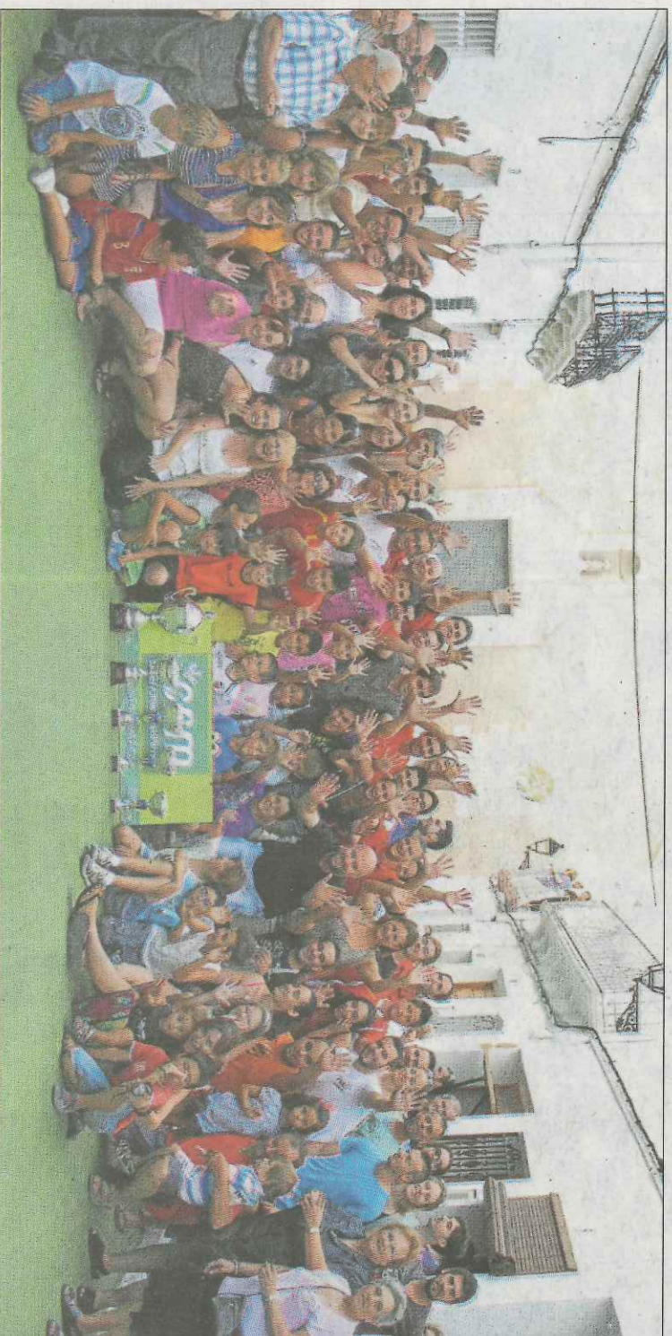
Integrants del club de pilota de Bicornp, un dels referents en el món del raspall, celebren els cinc títols autonòmics aconseguits en 2012.