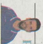
JUGADOR DE L' EQUIP DE BENDORM

S emblava un dissabte normal, però de sobte em vaig donar compte que començava la Liga i amb ella la responsabilitat de defensar el títol. Així que després de menjar el meu plat de pasta amb tonyina em vaig preparar la moxkilla amb la il·lusió d'un xiquet menut, perquè a més de començar la Liga, ho feia estrenant pantalons amb nous patrocinadors.