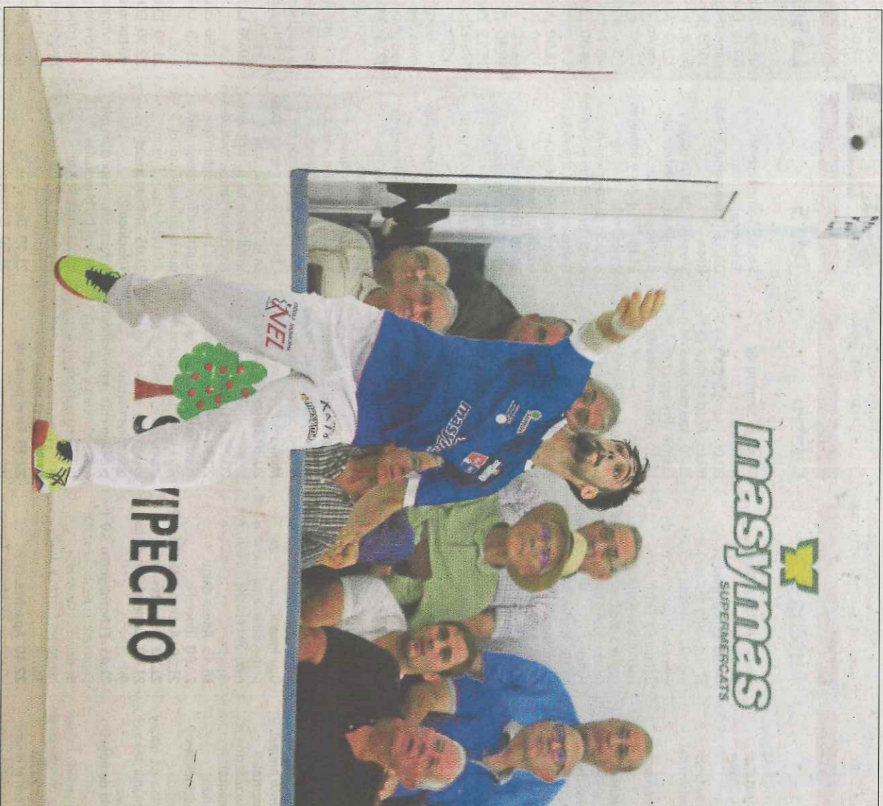
Giner participarà en la partida d'escala i corda en la sessió programada hui a Guadassuar. FUMPIVAL

La segona jornada de la fira es completará el dia habitual de par-