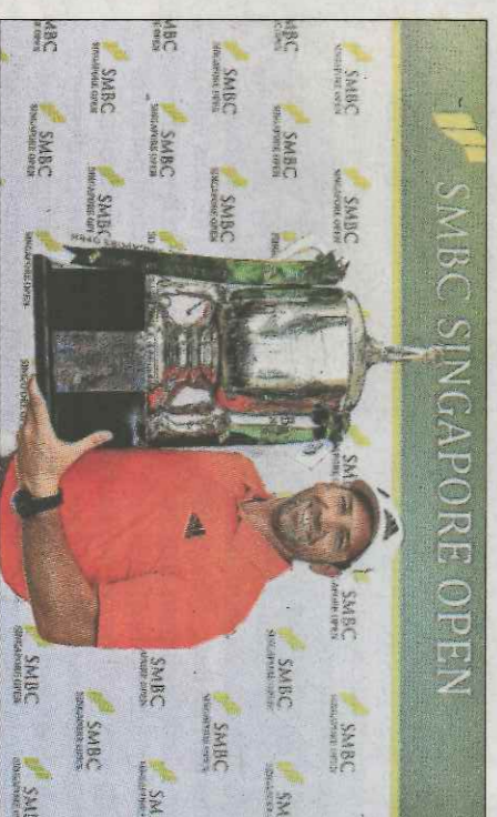
Sergio García, campeón del Open de Singapur.

Esta es la sexta victoria de Sergio García en el Circuito Asiático después de las obtenidas en Corea (2002), China (2008), Malasia (2012), Tailandia (2013) y Vietnam (2015).