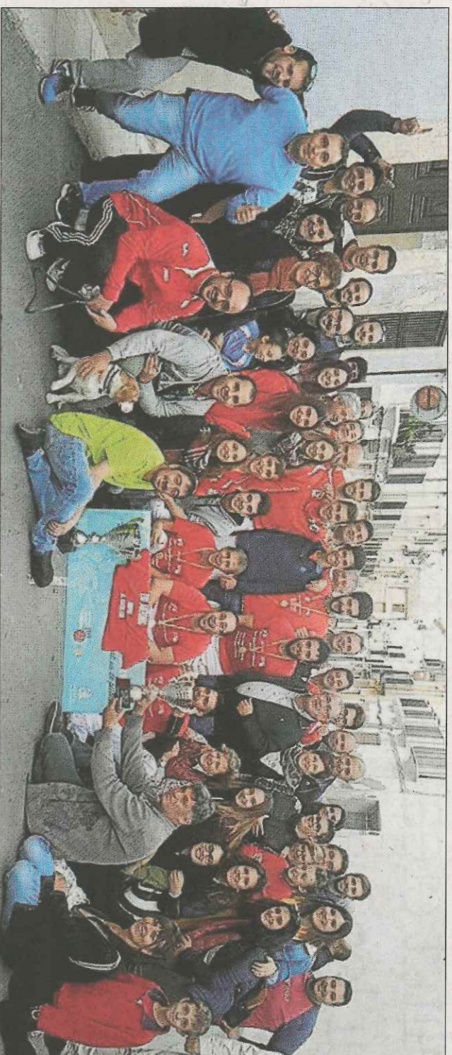
Integrans del club de Sella celebren el desé títol de perxa en la final celebrada a Penàguila el passat mes de novembre.