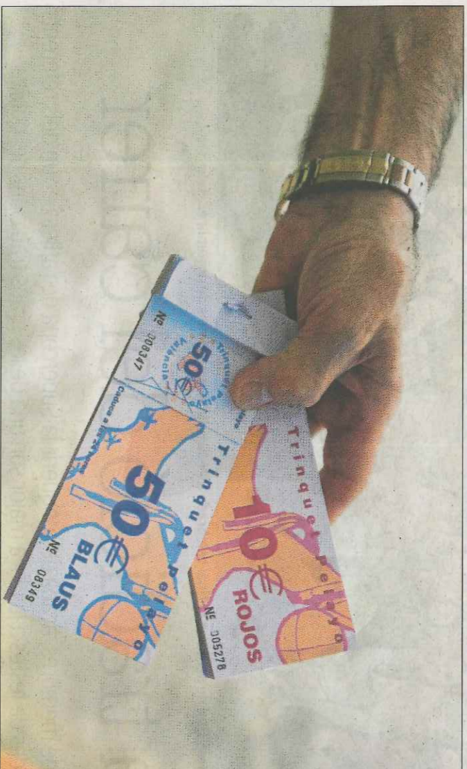
Talonari de travesses al trinquet de Pelaiyo, en una imatge d'arxíu.

EMV, els trinqueters hauran de tributar este 1,5% respecte al preu dels nous talonaris de travesses que ara autoritzarà Hisenda.