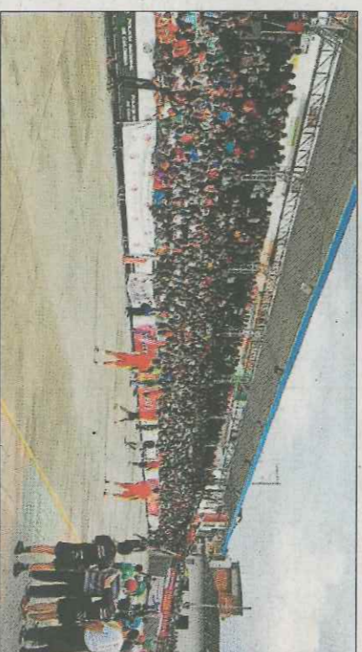
La selecció valenciana va jugar a chazas a Colòmbia.