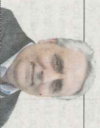
VA DE BO

El frontó de Freres de Traiguera va acollir els mestres participants en una jornada divulgativa impulsada des de la Generalitat Valenciana dins d'un pla estratègic de formació del professorat. Hi ha interès a recuperar una de les modalitats més singulars del conjunt de la pilota valenciana. Modalitat de joc indirecte emparentada amb altres del País Basc, d'Aragó, i de terres de delà els mars. També amb la pilota a mà en l'àmbit de parla anglesa. El joc de Fines nascut en les parets de les esglésies angleses col·loca els freres en el centre de la pista, ben visible. La grandesa del joc de pilota