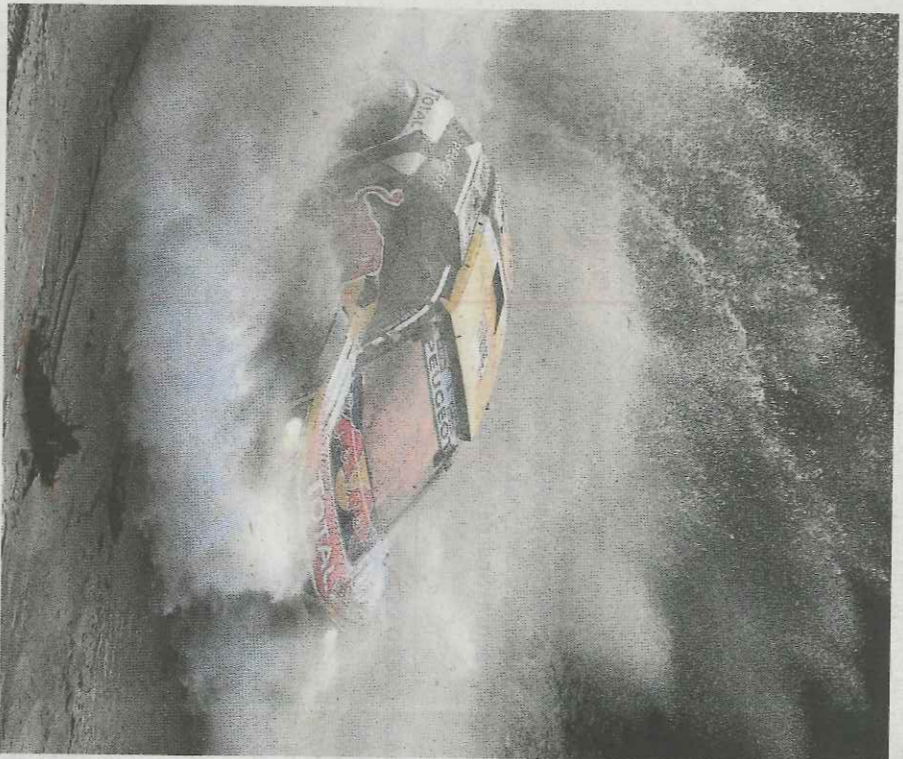
Carlos Sainz, durante la etapa de ayer en el Dakar.

Y es que este Dakar no va a dejar margen de fallo. Dejarse más de un cuarto de hora en la duodécima jornada de trabajo no entraba dentro de los planes y, aunque aún tiene 44 de colchón, Peterhansel y Al-Attiyah (este a la espera de un milagro) han prometido batalla hasta el final. Aunque todo apunta a un nuevo doble de Peugeot, los hombres de Toyota van a intentar arañar la victoria en los últimos kilómetros de competición. Cosas más raras se han visto en las 39 ediciones del Dakar.