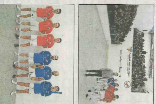
Moments de les finals del II trofeu Fundació José Luis López que es van jugar ahir al trinquet de Pelayo.