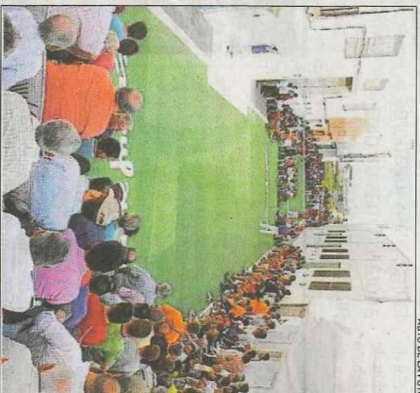
AUTO DE LA FOTO

moció de jòvens i a la pilota femenina, envejada en tot el món. Alguns d'aquells pobles pioners del que va acabar sent el Trofeu El Corte Inglés de Galotxa volen recuperar la iniciativa, veient un panorama alacaiquí. Han decidit, en assemblea, crear una competició que recupere el joc en els carrers tradicionals. És la manera d'intentar capgirar a noves generacions, que no necessitaran desplaçar-se a un recinte tancat. La pilota en el carrer té vocació integradora, desitjos d'abraçar a nous aficionats, mostrar-se com el valor cultural que és. Vol fer-ho, com hui pot fer-se: amb l'estructura competitiva que garanteix l'entitat federati-