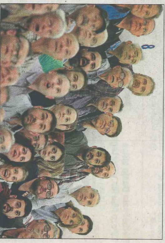
Puig va presidenciar la seua primera final individual des de l'escala. WM

Però els protagonistes seran els aspirants als primers títols de l'any. En la final de raspall, Ian, Coeter II i Seve jugaran contra Sergio, Britsca i Tonet IV. En la d'escala i corda, Soro III, Félix i Tomàs II s'enfrontaran a Puchol II, Raulí i Carlos.