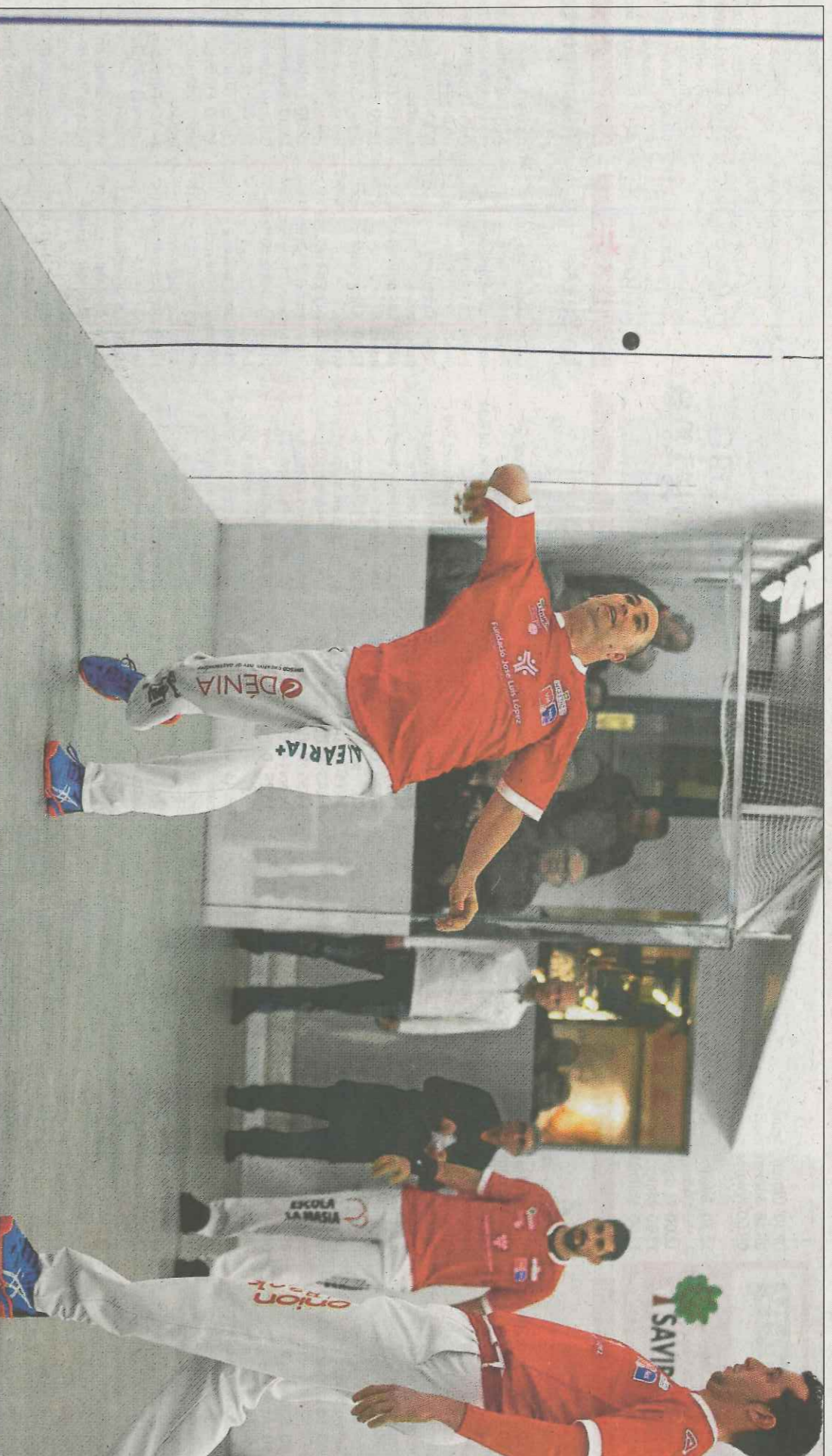
Soro III, Félix i Tomàs II jugaran la final de la modalitat d'escala i corda. VAL NET