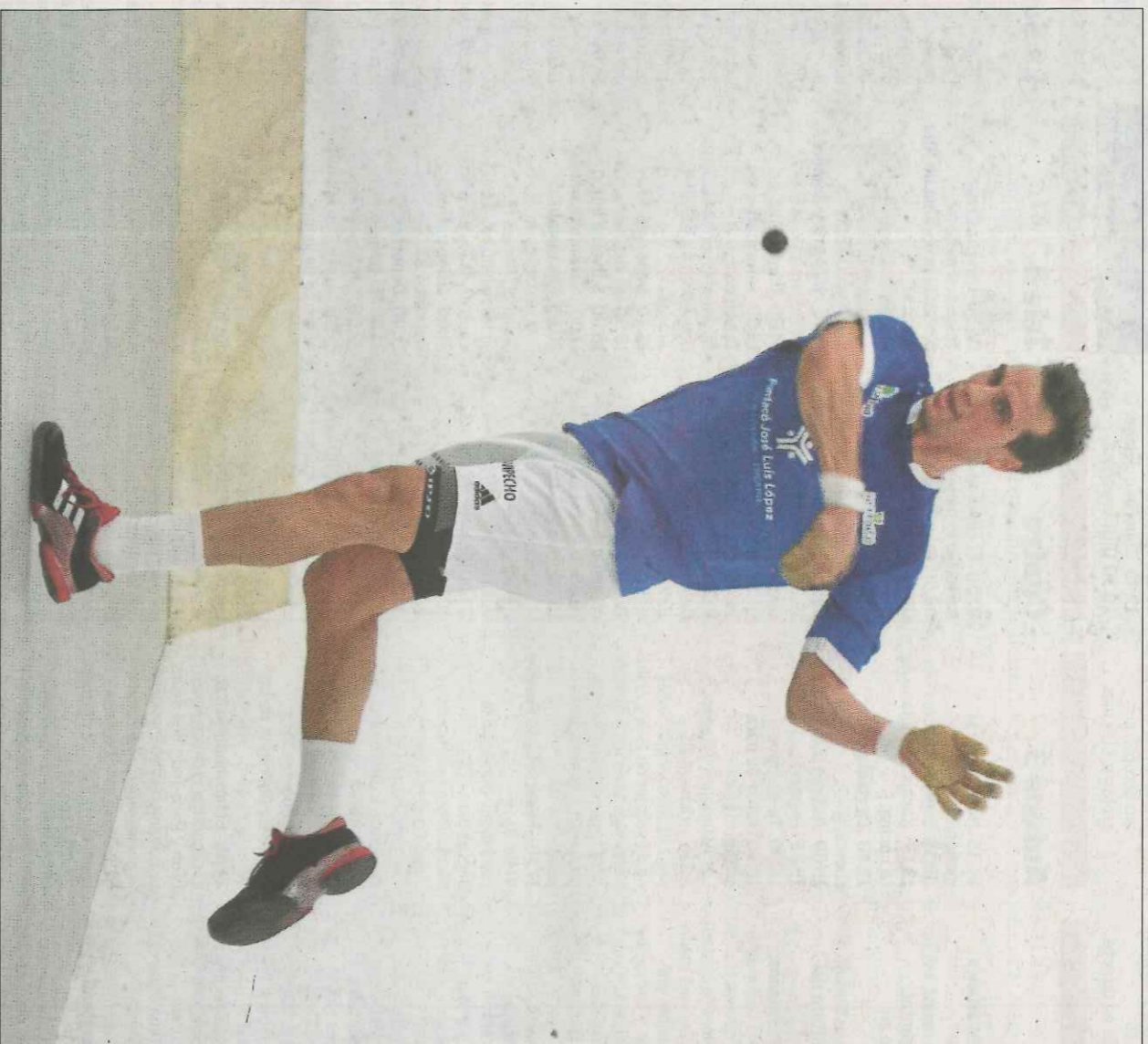
Moltó viu una situació límit i inclús es planteja la retirada tot i ser una de les figures més destacades. VAL NET

Poques, molt poques, eren les persones que estaven assabentades del seu pensament. Naturalment