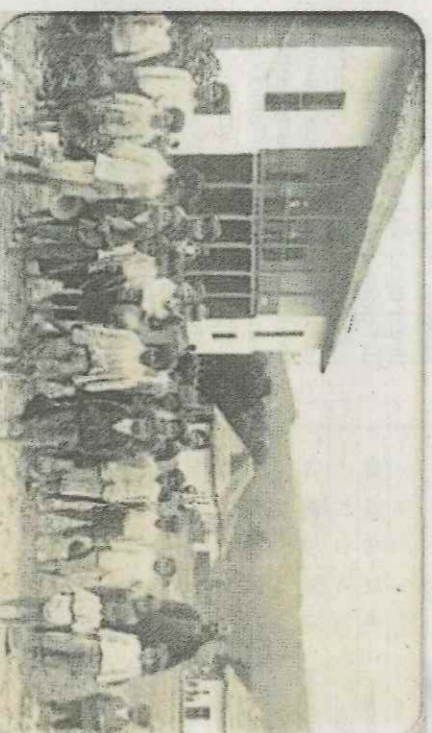
Mococa i xiquets a principis del segle xx.

parada amb la realitat vital daquell allunyat racó on només la violència tenia cabuda. I fins on acudien científics disposats a estudiar els efectes medicinals de les «plantes dels deus», l'ayahuasca o yagé, un al·lucinogen d'efectes fulminants. Segurament va ser la planta que, contra la seua vo-