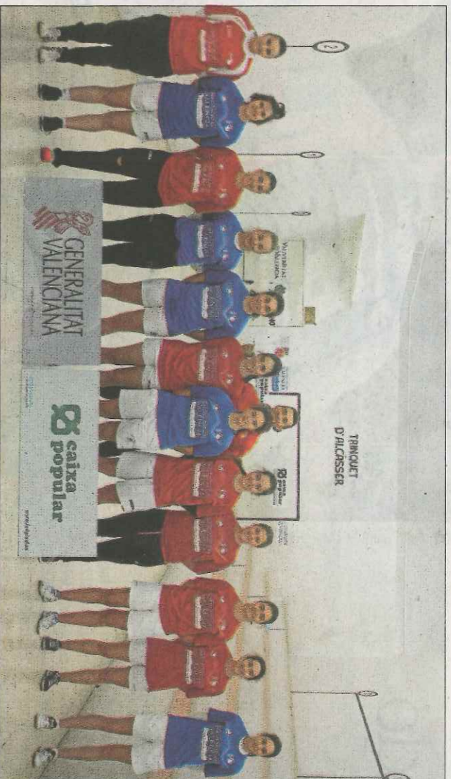
Algunes de les jugadores que participaran al Circuit, entrenant a Alcàsser.