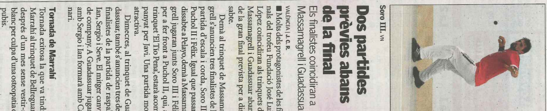
Soro III. VM