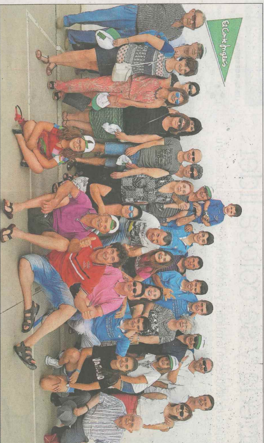
Members del club de Beniparrell en una partida del Autonòmic de galotxa El Corte Inglés.