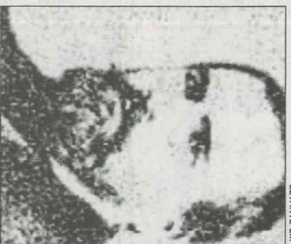
Santacruz, en la seua joventut.

Tres huires després es va dirigir a les entranyes del sud de Colòmbia, on se li va conèixer com el pare Lloyd. Arre va quedar el sanguinari capellà Santa Cruz. Allí missionà entre la població indígena. La guerra dels Mil Dies entre conservadors i liberals que va assolir el departament de Nariño li va comprometre. Hi ha versions contradictòries sobre la seua implicació o la seua desafecció a la mateixa però el cas és que el capellà va decidir anar de Nariño a la cerca de Mococa, en el departament del Putumayo, a l'Amazònia colombiana.