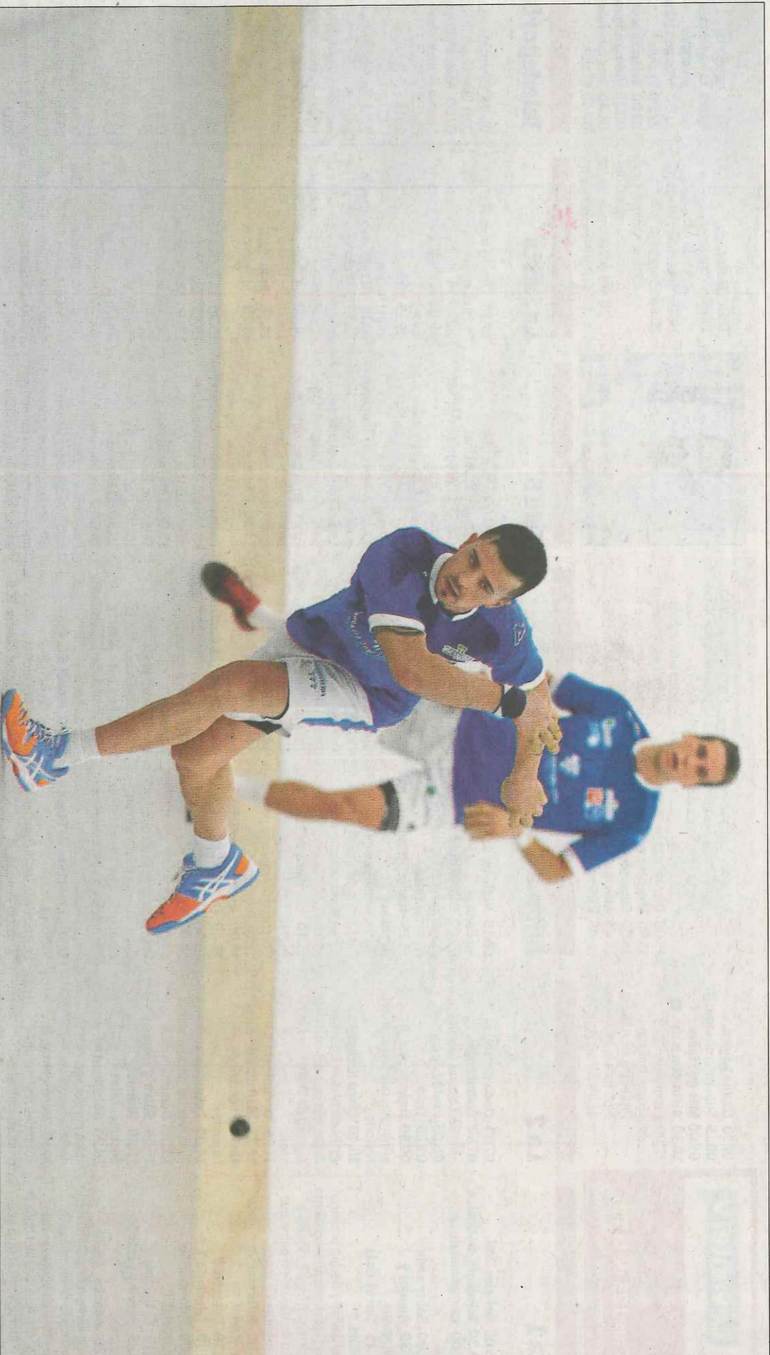
El millor raspall torna al trinquet de Pelayo de la mà del Trofeu Fundació José Luis López.