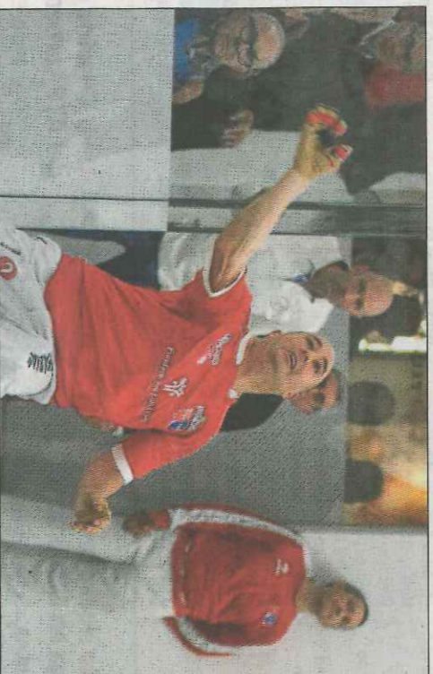
El torneig d'escala i corda tancarà la sessió de hui.