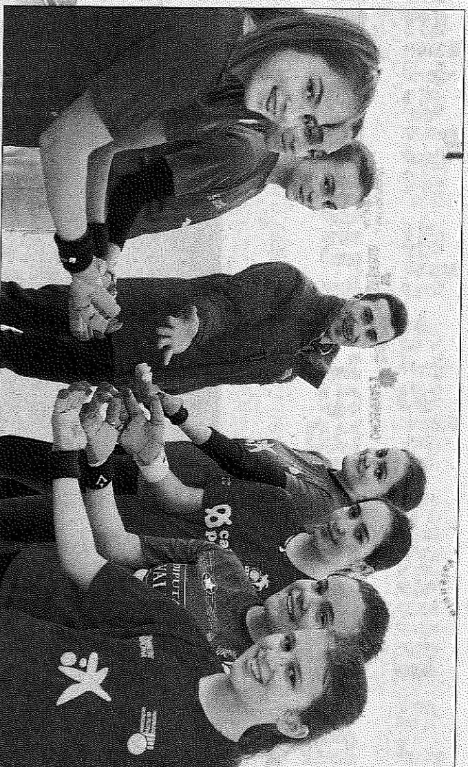
Jugadores de totes les edats van passar ahir pel trinquet de Pelayo durant tota la jornada. H. A. MONTESINS

Los malagueños son décimos en la clasificación y están a una sola victoria del Khimki Moscú, que marca el corte de acceso a cuartos de final. Para ello, Unicaja debe seguir muy firme con el apoyo de su público ante el empuje de Brose Bamberg y Estrella Roja, quienes pisan sus talones a una victoria.