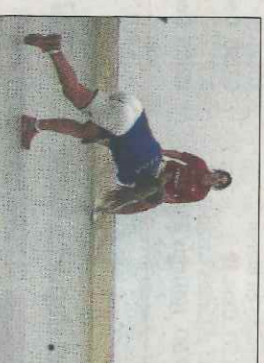
Partida femenina a Pelayo WM

Xiquetes i dones de 10 a 60 anys estaran entrenant per a millorar aspectes com la raspada, el traure o la col·locació. Tot al costat d'un dels millors entrenadors de la modalitat de raspall i que és l'encarregat de la tecnificació i perfeccionament en les escoles de tecnificació i Cespiva