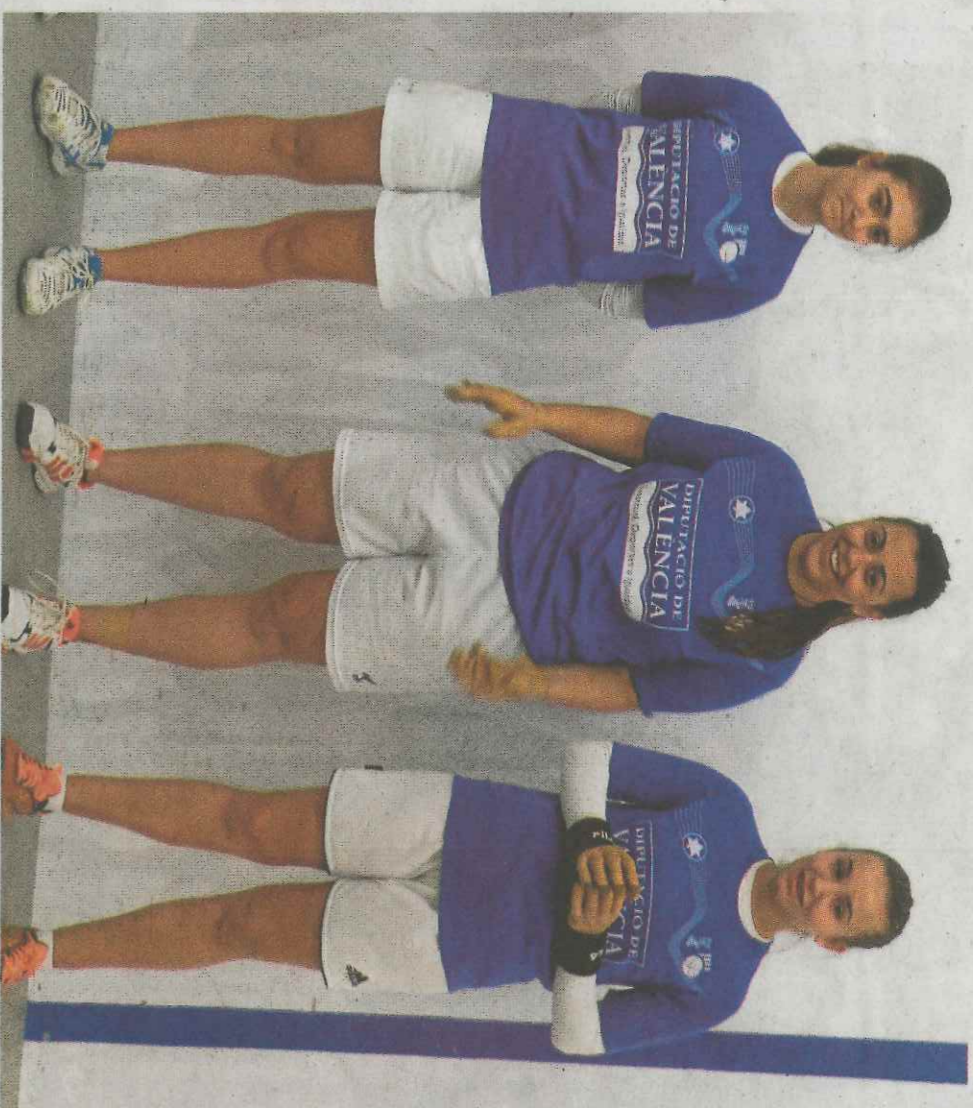
Las ganadoras, justo antes de arrancar la partida.

El Celta percibió los problemas del Deportivo a los dos minutos cuando Schär despejó un balón en semifallo ante Maxi Gómez, y los aprovechó en el siguiente ataque. Pione Sisto colgó el balón desde la banda derecha y Adrián López tardó en reaccionar cuando se dio cuenta de que Wass estaba solo en el segundo palo para rematar a placer y adelantarse al Celta. El Deportivo intentó reponerse del tempranero gol-pe que se llevó. Colak, al que le costó mover al equipo en ataque, probó a Rubén Blanco con un disparo