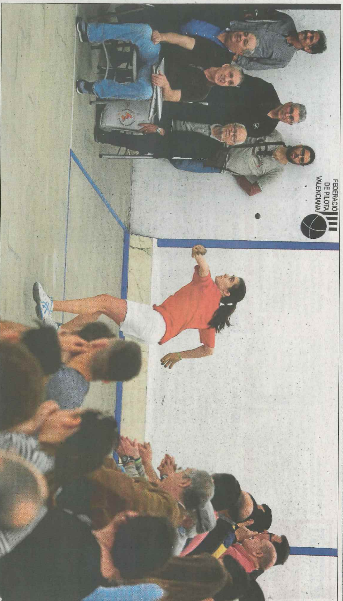
El trinquet de Pelayo acull esta vesprada la disputa de les dues semifinals del primer Trofeu Mestres femení.