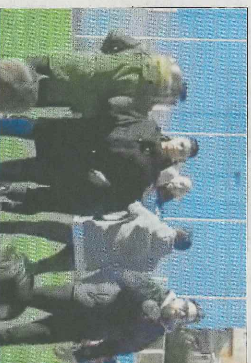
Tensión entre los padres en un partido de querubines.