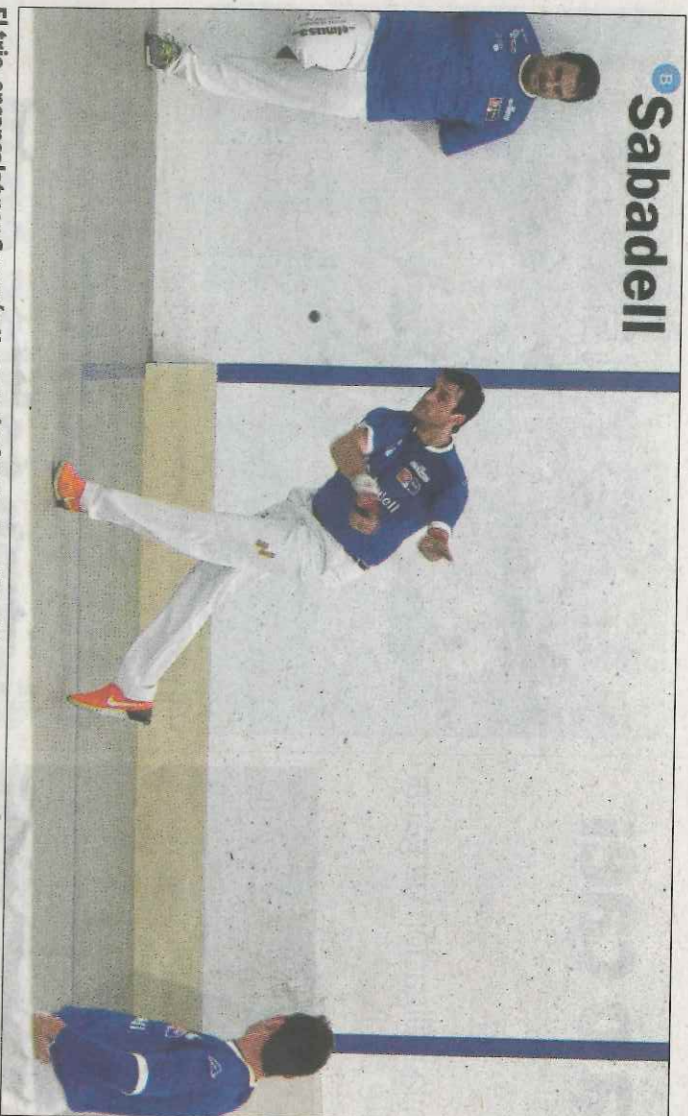
El trio, encapçalat per Genovés II, es va desfer de Soro III i Félix en una gran partida. VALNIE