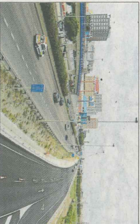
Tráfico de vehículos en la Pista de Silla.