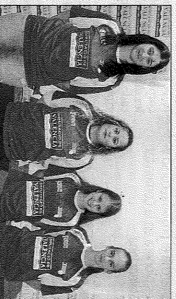
Meliana i Borbotó, a per la final de tercera femenina. FPV

Els dos clubs comptaran amb dos finalistes cadascun la vesprada de demà. En el cas de Montserrat, l'equip d'Àndrea, Eva i Carol jugarà la final de segona a les 16 h, davant el Moixent, amb Nerea i Natàlia. El club de Montserrat repetirà representant a continuació, ja que jugarà la final de quarta A contra La Vall D. Altre club d'enhonorada, perquè la partida de tercera comptarà amb La Vall C i Miró d'Alcoi. Sent aquesta final la que finalitze una intensa jornada amb sis partides.