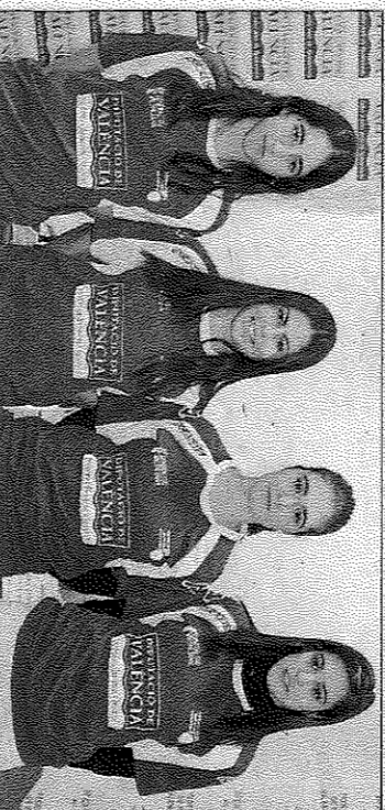
Bicorp optarà al títol de primera femenina, davant el Beniparrell FPV

al club de Xeraco, guanyador en cinc edicions, distanciant-se de Beniarres, Alzira i Aielo de Malferit, tots ells amb dos campionats aconseguits.