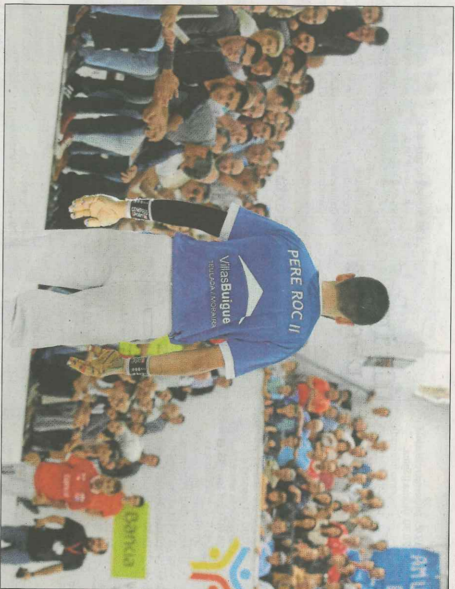
L'estabilitat dels pilotaris professionals i omplir els trinquets són dels principals objectius de la Fundació. VN