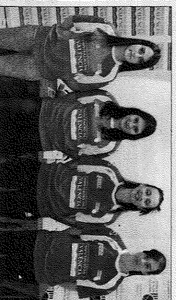
La final de plata femenina, per a Moixent o Montserrat.