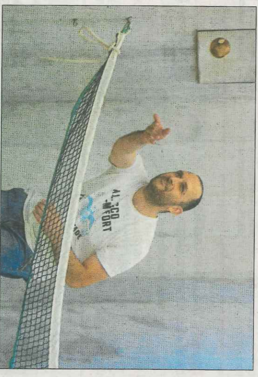
Un aficionat jugant a pilota grossa a Parcent. MUSEU DE LA PILOTA

Els dos restos són els participants que més han destacat en les darreres setmanes pel seu bon fer en el prestigiós Trofeu Savpecho. La segona semifinal es jugarà el diumenge de matí i la final el dia 22.