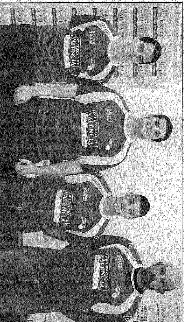
El diumenge s'enfrontaran els clubs de Rafelbunyol i Bicorp per primera vegada en la final absoluta.