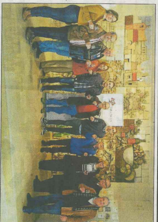
Moment de la visita a les instal·lacions de la DO València. 00v

Esta mateixa vesprada jugarà contra Soro III en el trinquet de la localitat de Guadassuar. Serà la primera confrontació entre els dos grans dominadors de l'escala i corda des del passat estiu. I el pròxim dissabte, semifinal del Trofeu Messeres en Pelayo.