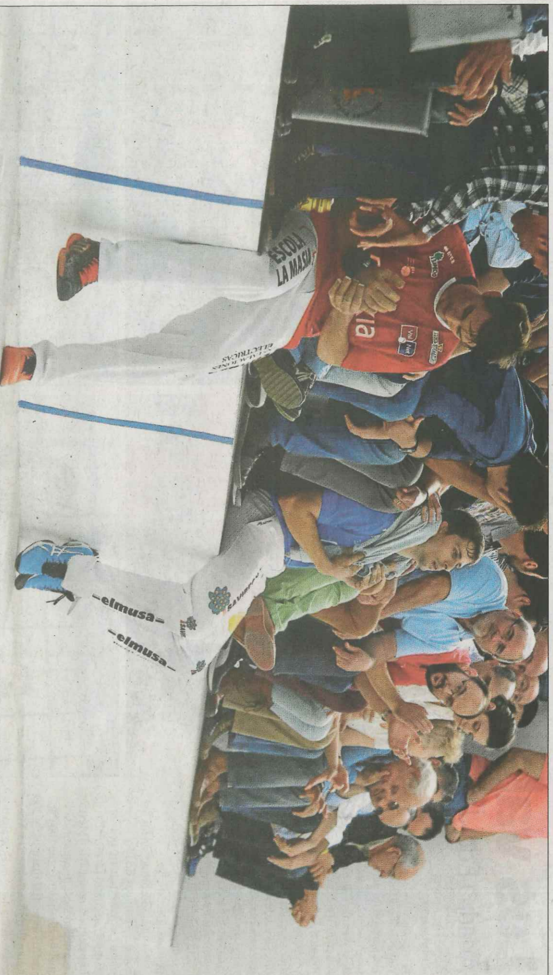
Soro III i Puchol II són els grans dominadors de la modalitat d'escala i corda des de fa diverses temporades. VALNET