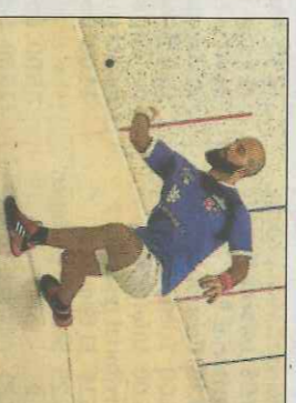
Diferents moments de les finals i la jornada de cloenda del Trofeu Mixt Savipecho, ahir en el trinquet d'Oliva.