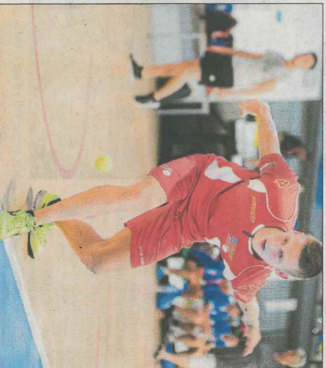
Sacha és pioner en este tipus de trobades.

I com sol passar als trinquets valencians, la «càtedra» de l'One Wall, els que van preveure que Timbo guanyaria amb facilitat, van encer-