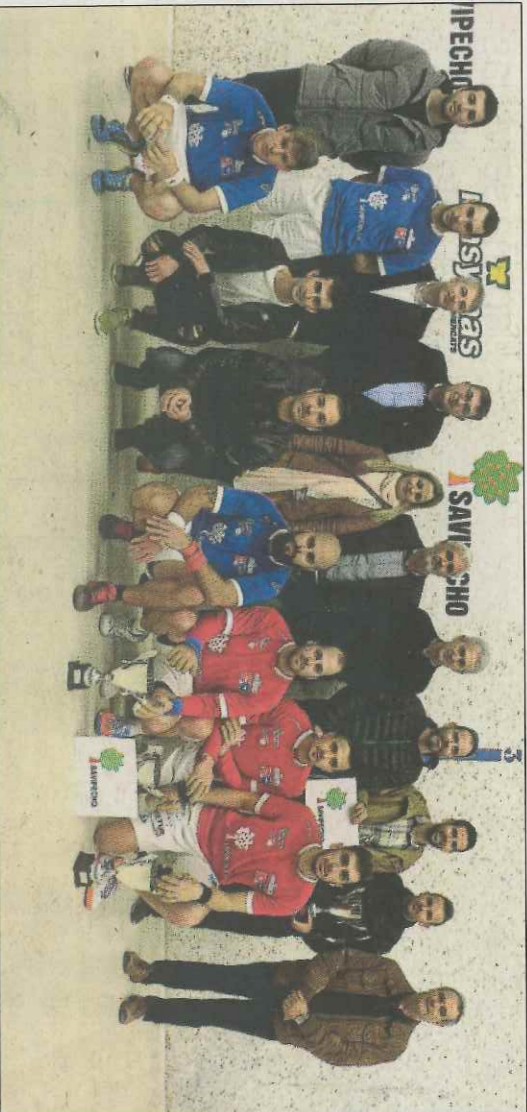
Els finalistes de la modalitat d'escala i corda i de raspall, ahir al trinquet d'Oliva.