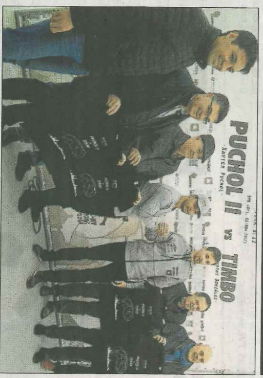
Presentació ahir a Pelayo de la partida de Nova York.