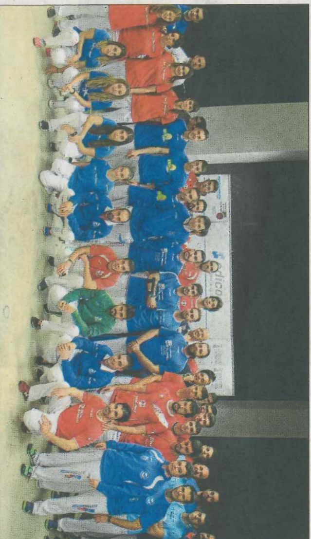
Tots els jugadors protagonistes de les finals que es jugaran al carrer de Borbotó.

El president de la Federació va agrair el compromís de Edicom i va dir que tots els jugadors de galotxa «se senten com a casa en aquesta empresa valenciana». Sanjuán va voler recalcar la bona organització dels clubs de galotxa, la seua estructura sòlida i la varietat d'equips que aconseguixen arribar a les