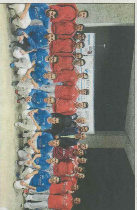
Lliria acull demà les finals de les quatre categories de trinquet.

finals. També va dir que alguns dels campions del mundial disputat recentment, han eixit de competicions com aquesta (Puchol II, Nacho de Beniparell, Ana Belén, Mónica...).