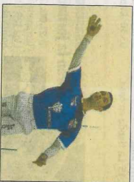
Pere de Pedreguer. VN

En un principi semblava que la pilotada que va rebre el passat divendres a Sueca quedaria solament en el colp i en els punts de sutura com a record. Però el dilluns, en notar molèsties i sagnar, va ser sotmès a unes proves que van desvelar que el nas estava trencat i desplaçat.