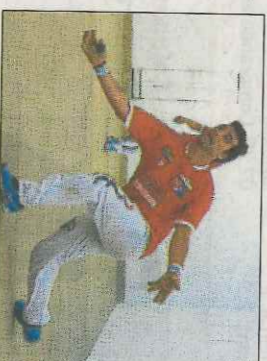
Monrabal de Vilamarxant. VN

La mostra és una recopilació dels pilotaris locals començant des de finals del segle XIX amb el Tio Mona fins als xiquets que hui en dia aprenen en l'escola. No estan tots, segons informen des del consistori, però quasi «Hem volgut reconèixer i donar-li notorietat a la gent que