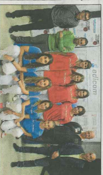
Les xiques disputaran la seua segona final del torneig. FPV

La primera de les finals de carrer de l'Edicom-Interpobles 2017 es jugarà demà dissabte a partir de les 16 hores, en el carrer de pilota de Borbotó, entre els equips d'Inmobiliaria Planaca Foios i Ca Gines Massalfassar, de tercera categoria. A continuació, sobre les 17:30 hores, serà quan juguen les formacions de Vinu Raurea Les Valls i de Caixa Popular Meliana pel títol en la divisió de plata. La canxa de Borbotó viurà aquesta sessió i les dues més del diumenge.