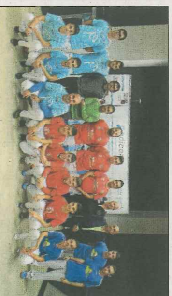
Les finals de primera i juvenils el diumenge a Borbotó.