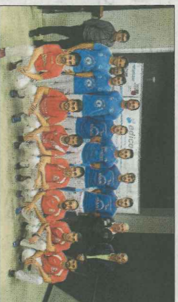
El dissabte es viuran les finals de segona i tercera.