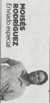
MOISÉS RODRÍGUEZ Enviado especial

Los resultados deportivos han sido lo mejor en un evento con nota alta en la organización logística pero caótica en la competición