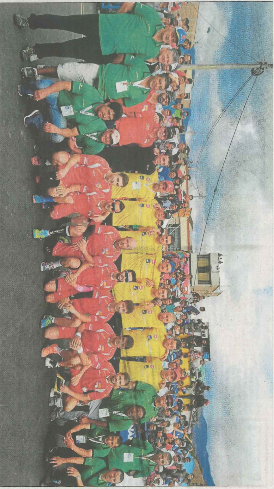
Els moments previs a la victòria més important en el Mundial de Colòmbia, la de la final de llargues contra Bèlgica.