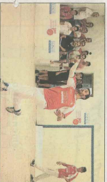
Faura es jugarà el liderat a Algímia.

Respecte a la divisió de plata fe- menina el Moixent C i el Montser- rat B aconseguíen igual resultat, 25 per 10, davant el Beniparrell C i el Beniparrell B en l'anada de semis. En tercera son Meliana A i Oliva C qui jugaran la primera semifinal, sent la segona entre Borbotó C i Beniparrell D. En quarta A es Me- llana G qui apunta a la final, des- prés de deixar en 10 al Beniparrell E. Beniparrell F guanyava per la mínima al Borbotó D. Per últim, en quarta B, Favara i Campello tancaven l'anada en un 25 per 15.