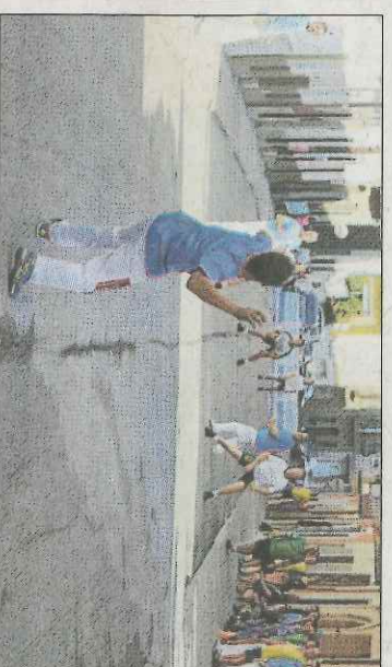
El joc a ratlles viu una època d'activació. FPV

Els grups de primera categoria d'Autonòmic d'Escala i Corda tenen aquestes formacions en el primer lloc. El pròxim cap de setmana, en el grup 1, el Lliria es jugarà la seua privilegiada posició amb el Marquestat, que figura empatat a punts amb els del Camp de Túria. Marquestat B i Ribera-roja jugaran l'altra partida de la jo- rada. En el grup 2, Faura acudirà al trinquet d'Algímia en una visita que pot donar canvis, ja que Faura i Alfara estan empatats al pri- mer lloc, mentre que l'Algímia està a només tres punts.