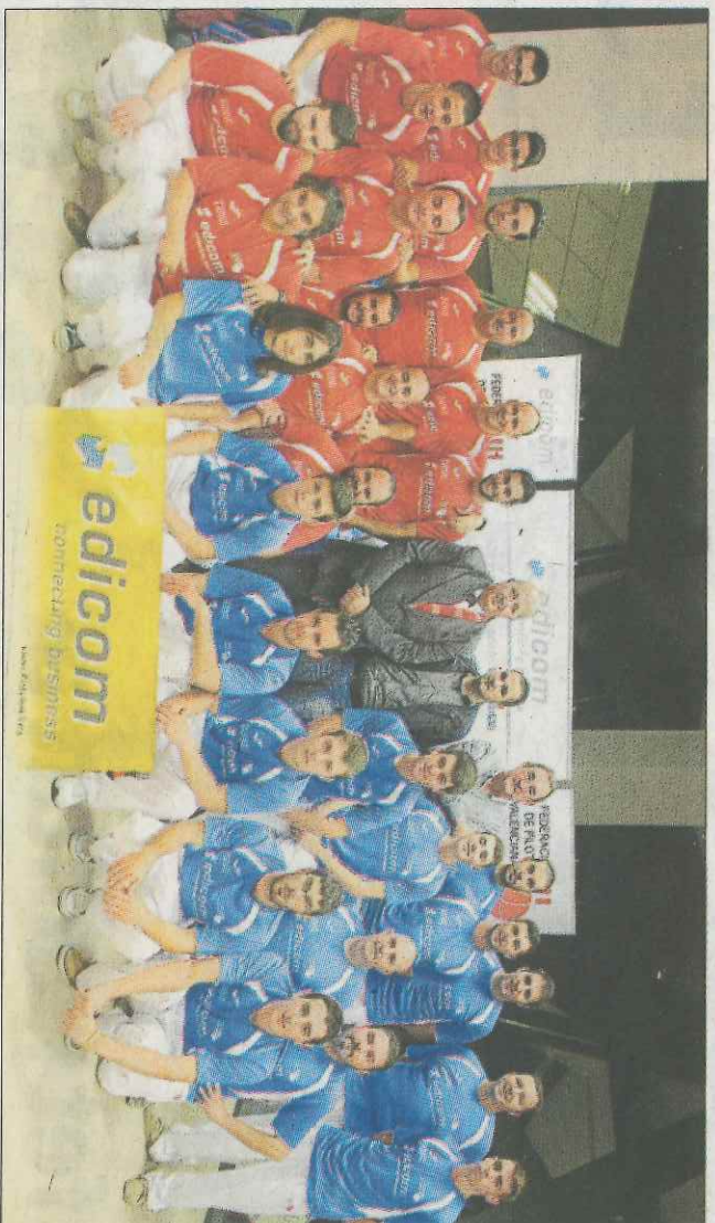
Les finals es presentaran el pròxim dimecres en la seu de l'empresa a Paterna. FPV

Respecte a la categoria juve- nil, l'Ajuntament de Beniparrell defensarà el trofeu guanyat l'any passat, després d'eliminar al Caixa Popular Meliana, sub- campió en el 2016. El rival de Be- niparrell serà l'Ovocity Marque- sat, que deixava fora de la final al Lanzadera Montserrat. Meli- ana C i Les Valls A apunten a la fi- nal de la divisió de plata, després dels favorables resultats de les partides d'anada. La final de ter- cera comptarà amb Foïos i Mas- salfassar com a protagonistes, a no ser que Godelleia o Borbotó, els seus rivals de semis, donen la sorpresa en les partides de tor- nada. Ja en quarta categoria el Quart B i Foïos E es perfilen com