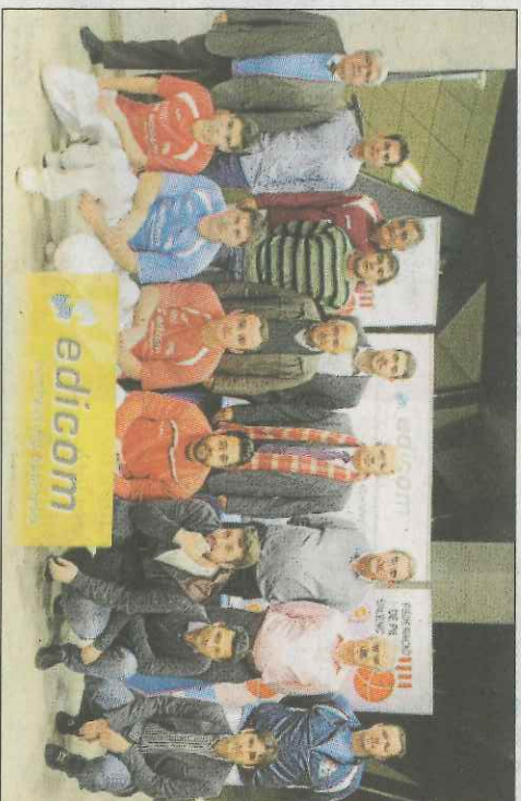
Edicom premia a tots els clubs i jugadors finalistes.

a finalistes. Respecte a la final de la competició femenina, el club de Borbotó viurà un derbi entre els seus dos equips, que han co- pat aquesta final.