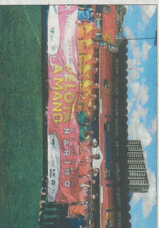
La selecció valenciana va estar sensacional en joc internacional.