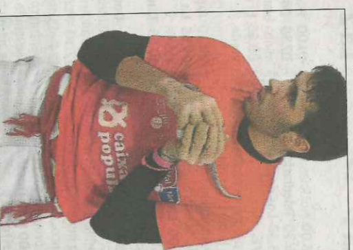
Álvaro de Massafassar. VN

La pissarra d'esta setmana torna a emparellar a Fageca i Marc pòques hores després del trinquet de Pelayo. Serà demà al trinquet de