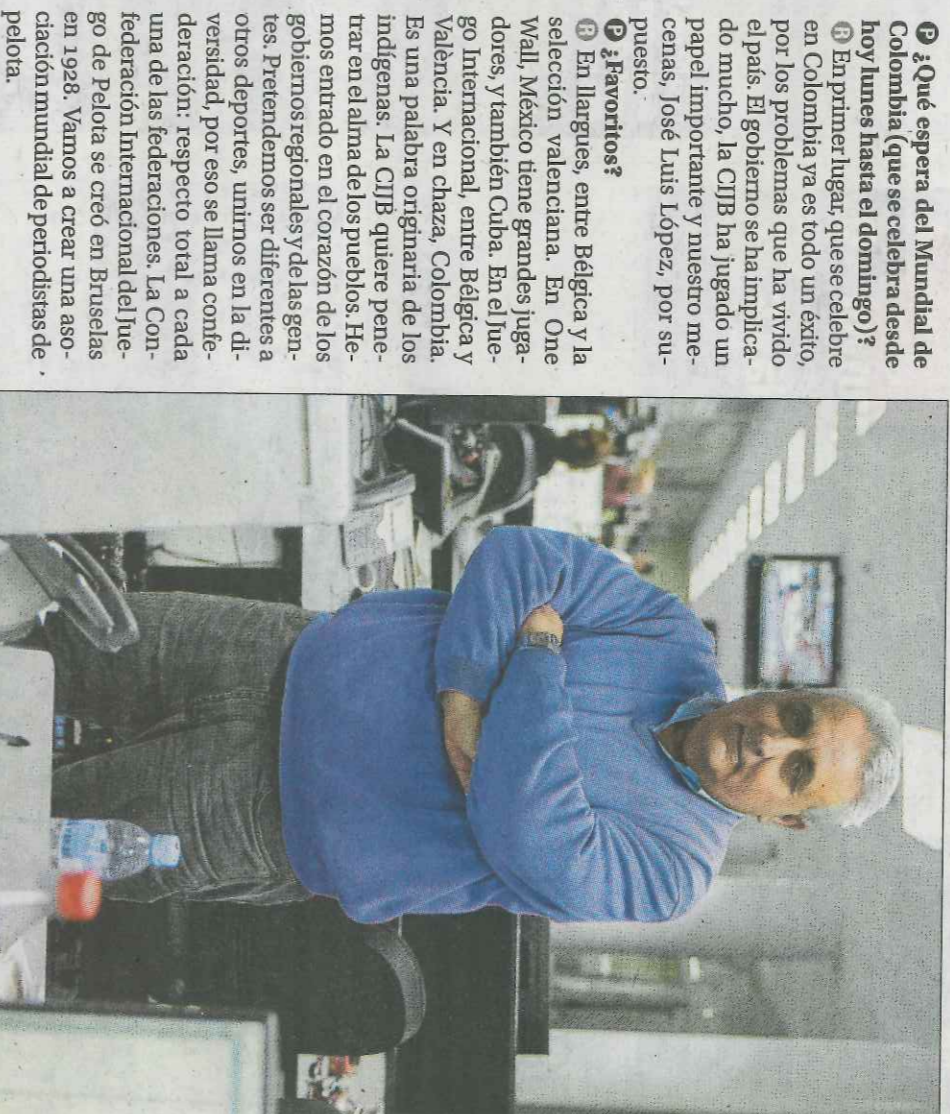
Soldado, el jueves en la redacción de Levante-EMV. FERNANDO BUSTAMANTE

P ¿Quiénes son las potencias mundiales en pilota ahora mismo? R En licencias e infraestructuras, Bélgica y Holanda. Y en América, México y Colombia. Ecuador está creciendo muchísimo. Y Argentina ha tenido cierta potencia. Pero hay que unificar criterios.