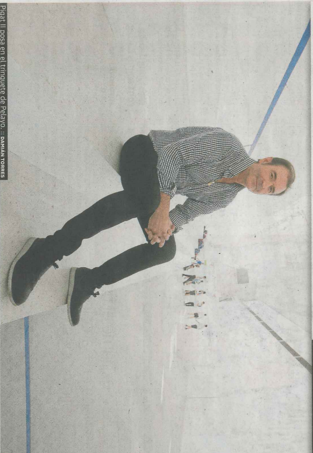
Pigat II posa en el trinquete de Pelayo.

Lo pide ya iniciada la conversación. Tampoco se recrea al tomarlo, no le dura toda la entrevista.