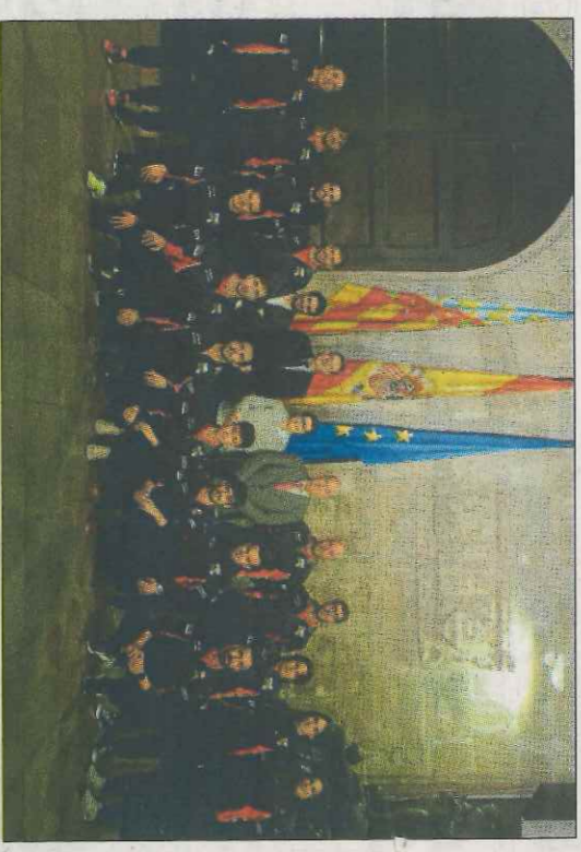
La selecció valenciana - Espanya, ahir en el Palau de la Generalitat.

Es per això que Pigat II ha confectionat un grup on, tot i la polivalència dels seus components, destaca la presència de grans especialistes de les llargues. Les altres modalitats a les quals es jugarà són les de joc internacional, one wall i l'autòctona de Chazas. La selecció femenina competirà en one wall.