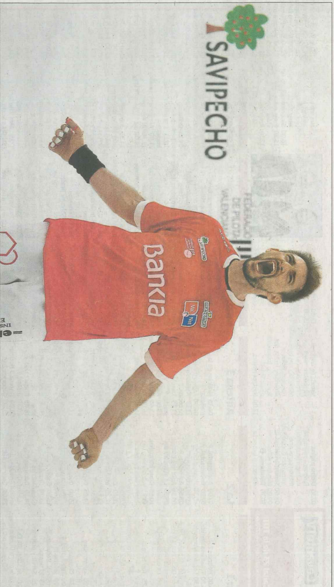
Soro III manté en el Trofeu Savipecho l'excel·lent nivell que va exhibir en el passat Individual. VAL·NET