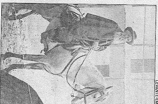
El capellà carlí, a cavall.

Home que no atenia més ordres que les seues va començar a sospitar dels propis caps carlins als que considerava presesos a la traïció. Amb 31 anys, en 1873, va fugir a terres del nord de França. Lille, on ho van acollir els jesuïtes. La seua vida no era la d'un monjo avorrit i