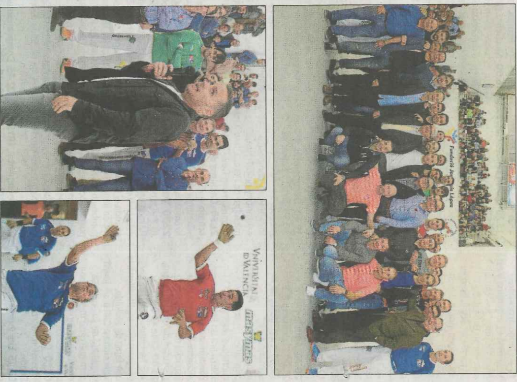
León es va acomiadar ahir en Pelayo, on va rebre una nova mostra d'estima per part del públic i dels pilotaris. VAL NET