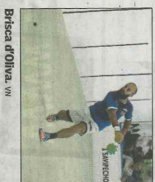
Brisca d'Oliva. VN

Després d'un primer joc igualat, amb el trio tombant un val, el domini dels blaus va ser absolut. Mol-