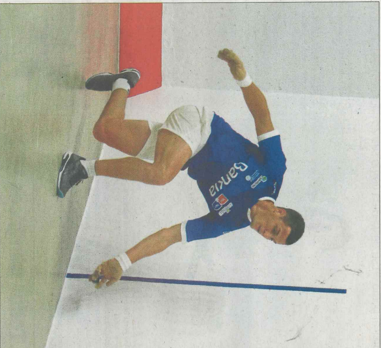
Tan li ha llevat a Moltó la condició de número u en la modalitat de raspall. VAL.NE1

I amb ells, jugadors imprescindibles com Genovés II, que va a més, o recuperats per a la pilota