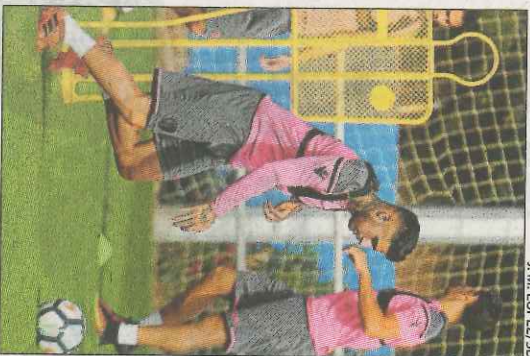
J. M. LÓPEZ/SO

El resto de jugadores comenzará la preparación del partido ante del próximo domingo 19 de noviembre (18.30 h.) ante Las Palmas en Gran Canaria. El duelo frente al conjunto insular, que acumula siete partidos consecutivos perdiendo, será la última oportunidad del Levante UD para revertir su mala racha antes de afrontar un auténtico Tourmalet navideño. Y es que, hasta el próxi-