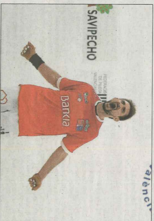
Soro III torna a Pelayo per a estrenar el nou regnat. VN

El quinze en este equip serà cosa de Jesús i Carlos, pilotaris als quals no els pesa esta responsabilitat. La seua mobilitat dins de la pista és un valor afegit, en este cas en la tasca de neutralitzar les escames dels de l'altre costat de la corda.