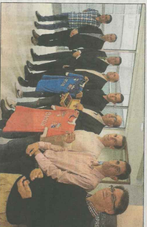
Els finalistes amb les autoritats i organitzadors. VN

Moltó afronta diferents reptes amb esta final. En cas de guanyar seria el tercer individual consecutiu, la qual cosa li atorgaria el fris