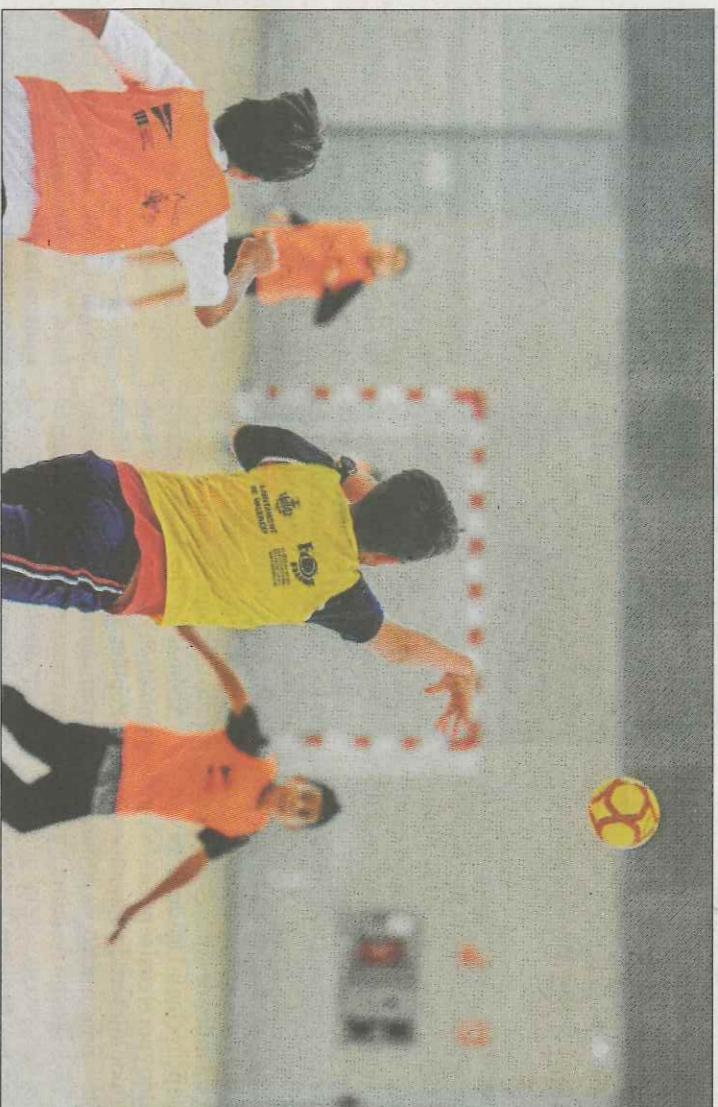
Les escolen oferixen la possibilitat de realitzar esport en el propi centre educatiu.

A més, en el mes de gener s'inicia de nou un període perquè els centres escolars puguen sol·licitar la formació de nous grups dels es-