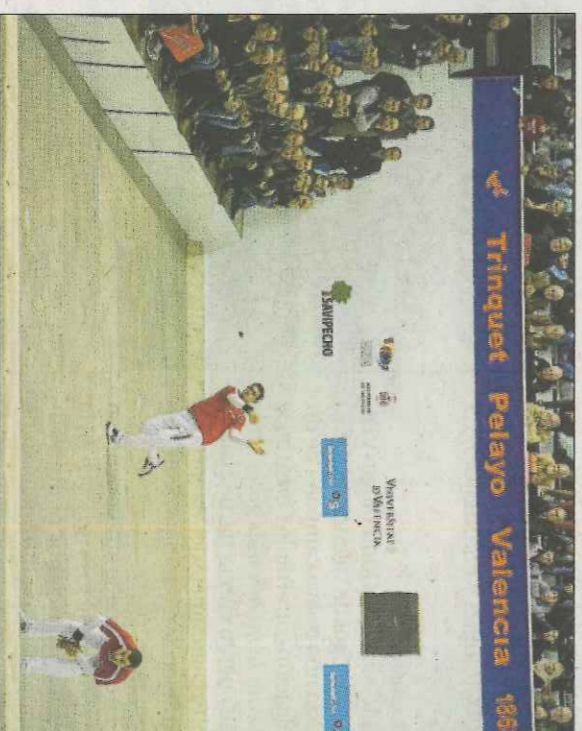
Una imatge del trinquet de Pelayo.

Es tracta de la primera vegada que es realitza un congrés multidisciplinari entorn de la pilota valenciana. D'esta manera experts de diferents àmbits, com l'esport municipal, patrocini, comunicació, instal·lacions, cultura o màrqueting debatten en comunicacions, ponències i taules redones, durant els tres dies del congrés sobre els millors mecanismes per a promocionar la pilota.