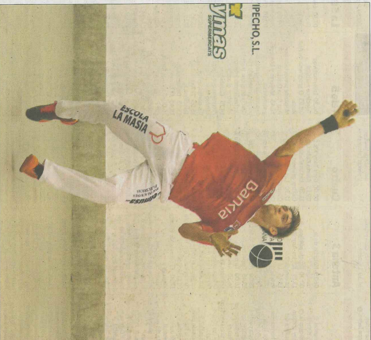
Soro III va guanyar a Bueno amb autoritat en el seu debut del passat diumenge a Sueca. VAL·NET

De la seua preparació, el pilotari destaca principalment el fet de no haver tingut una agenda massa carregada en les darreres setmanes.