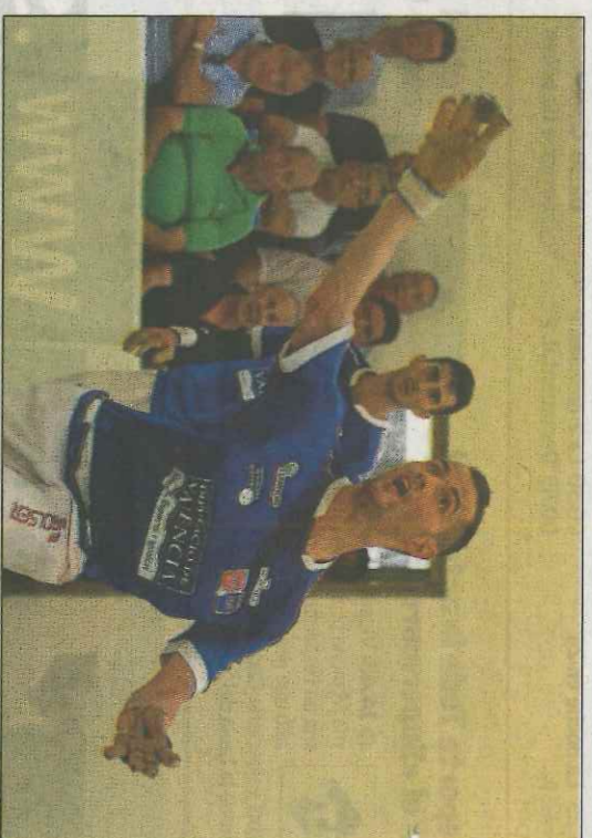
Pere jugarà hui a Benissa, on és monitor de l'escola de pilota. VM

La celebració de l'aniversari és el colofó a una sèrie d'iniciatives que s'estan portant a terme des de fa mesos. I el que és més important, el trinquet s'ha afegit a l'oferta setmanal professional, almenys fins que acabe l'any. El seu dia, clar, és el diumenge, rememorant així aquella frase que diu: «El diumenge, a Benissa, pilota i missa».